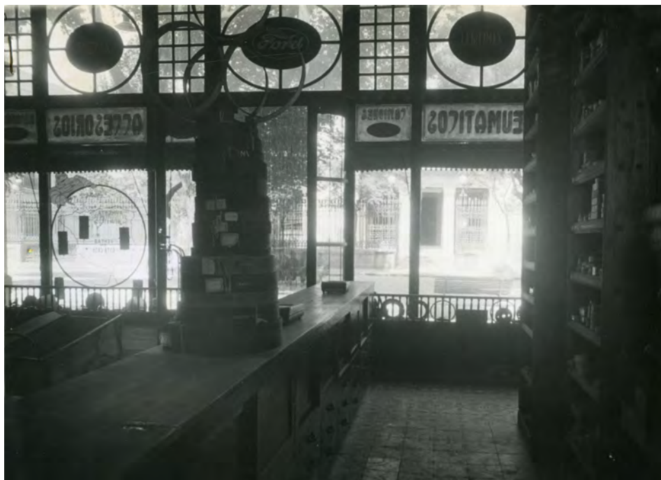
Fotografía 17. Desde esta perspectiva podemos observar en la cristalera de la izquierda lo que es la entrada al Palacio de la Diputación Provincial, y a la derecha la entrada al negocio de "Fotografía Giner". Expediente para la inclusión ..... Fotografías en carpeta I nº. 6 AMAB, Leg 853.