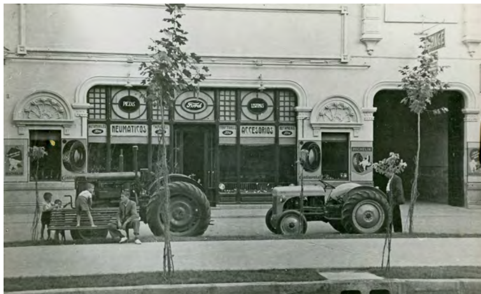
Fotografía 2. Fachada del comercio de venta de neumáticos y accesorios de la Casa Ford. Acceso a comercio y al taller. (actual Paseo de Libertad ). Expediente para la inclusión ..... Fotografía en carpeta I nº. 8 AMAB, Leg 853.