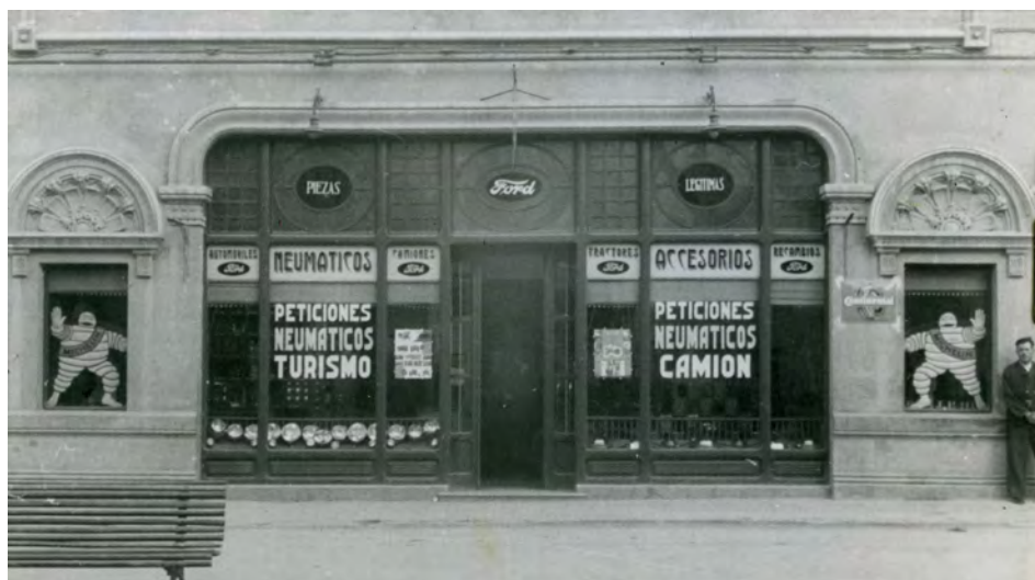
Fotografía 3. Fachada del comercio de venta de neumáticos y accesorios de la Casa Ford. Acceso a comercio. (actual Paseo de Libertad ). Expediente para la inclusión ..... Fotografía en carpeta I nº. 7 AMAB, Leg 853.