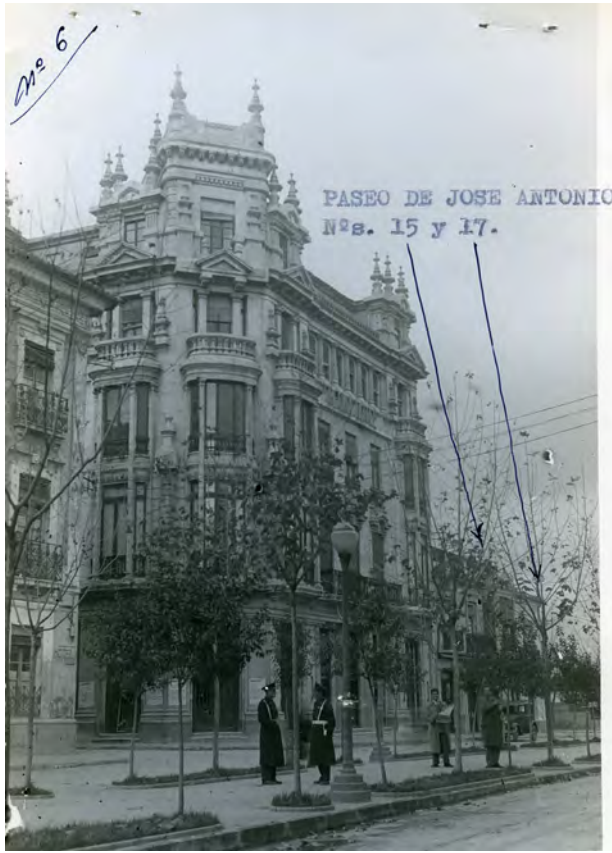
Fotografías 11 y 12. Margen izquierda del Paseo de José Antonio, incorporadas al expediente a fin de argumentar que existían efectivamente inmuebles de baja altura y que “desmerecían” frente a su negocio que sí estaba en “decoración” con el resto de los colindantes Expediente para la inclusión... Fotografías en carpeta II n os . 6 y 7 AMAB, Leg 853.