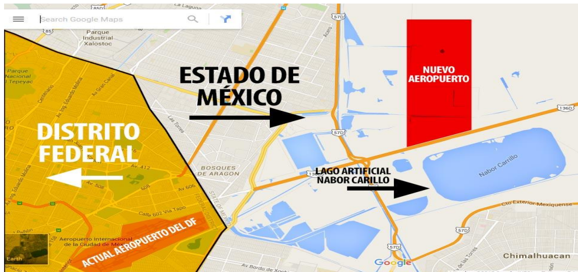
Figura 1. Mapa de ubicación del NAIM