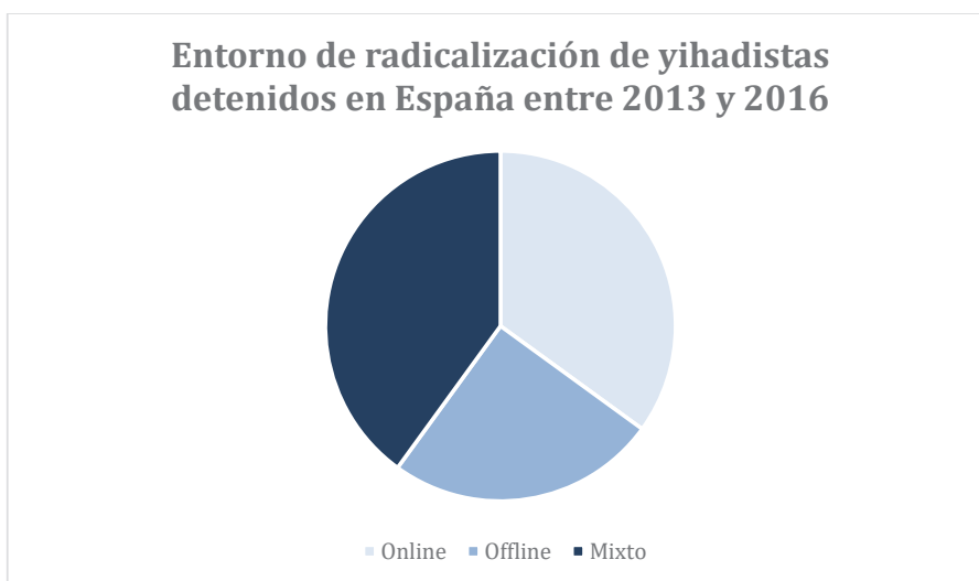
Figura 2: Entorno de radicalización de yihadistas detenidos en España entre 2013 y 2016.

Instituto Elcano mostró cómo se comportó la radicalización yihadista en España entre 2013 y 2016 tanto en el terreno online como offline. Un 40 % de los individuos pasaron por este proceso tanto en la red como en interacciones presenciales, un 35 % solo lo hizo en Internet y el 25 % restante únicamente en un ambiente offline 50 . Por lo tanto, se observa que la influencia del entorno online en los procesos de radicalización es significativamente superior en el contexto español.