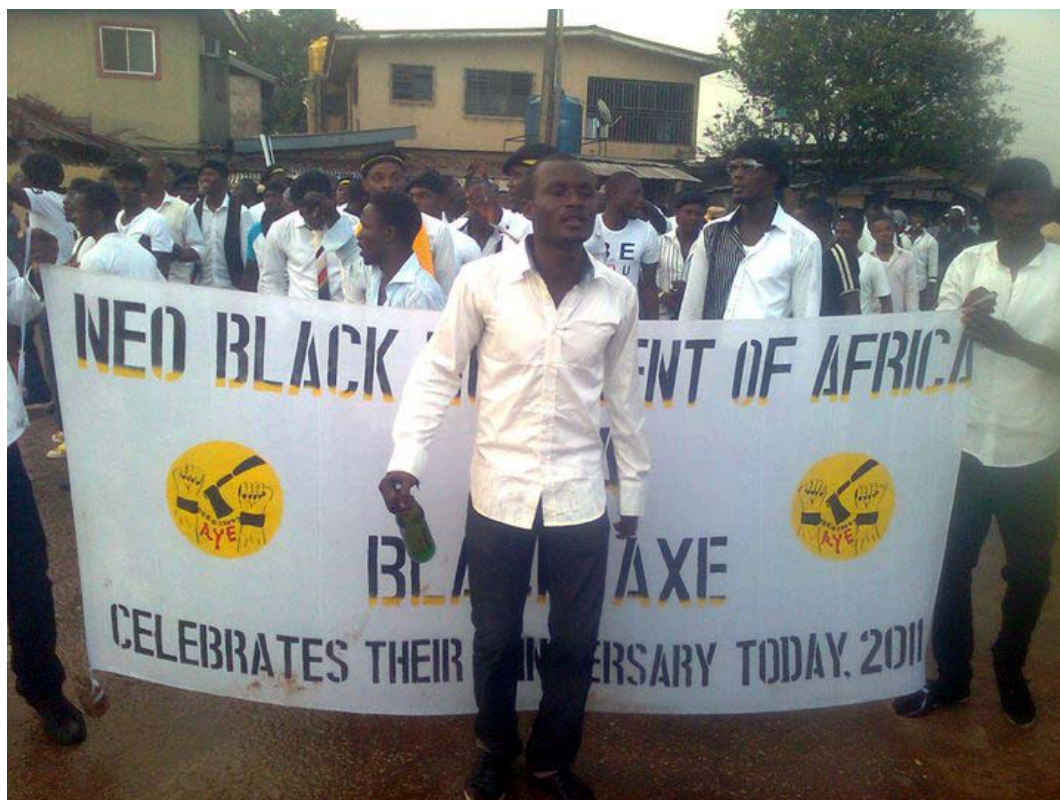
Figura 3: Miembros del grupo Black Axe-Aye

llevado a cabo en zonas boscosas y alejadas de las áreas pobladas. Es por ello que exigen a los nuevos miembros el pasar por pruebas muy duras y prestar un juramento de lealtad, debido a las peculiares condiciones en que van a desempeñar sus acciones criminales. Una vez dentro del grupo se incentiva atacar y eliminar a todo elemento que se oponga o constituya una amenaza para los intereses del grupo.