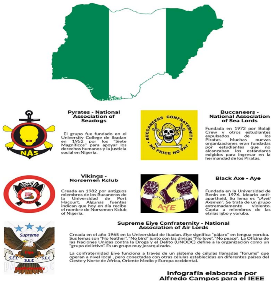
Figura 2: principales cultos secretos y confraternidades en Nigeria