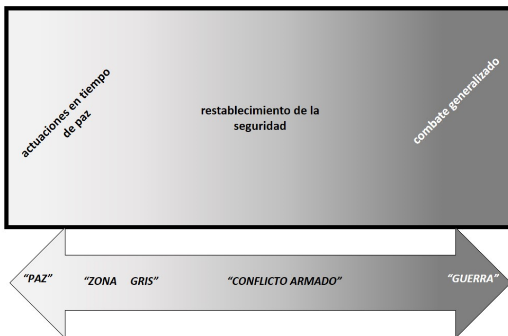
PDC. Capítulo 4. Figura 3. El espectro del conflicto

política de cooperación al desarrollo como uno de sus ejes de actuación «para garantizar un entorno internacional estable y, con él, la seguridad y prosperidad de los españoles» 8 . Y, refiriéndose al África subsahariana destaca que: «cualquier aproximación al África desde el punto de vista de la seguridad requiere de una perspectiva integral que enfatice vectores como el buen gobierno, las sostenibilidad de las economías o la pluralidad social, vinculando desarrollo y seguridad... En este contexto, la seguridad cooperativa 9 adquiere relevancia creciente, así como las iniciativas de diplomacia preventiva de España y su participación en misiones internacionales a través de la ONU, la UE u otros cauces, con mandato de pacificación y lucha contra el terrorismo yihadista» 10 .