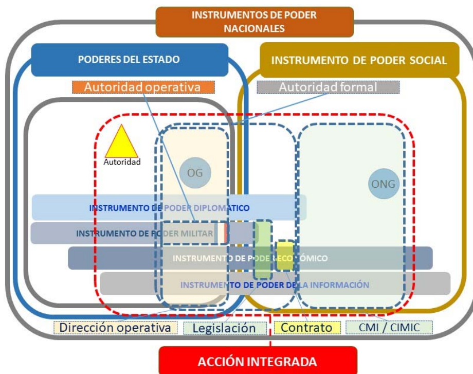
PDC. Capítulo 4. Figura 4. Acción Integrada

capacidades y actividades a emplear, pasando desde: las «actuaciones en tiempo de paz» 12 , en las que destaca la colaboración con las autoridades civiles y las Fuerzas y Cuerpos de Seguridad del Estado, la respuesta ante catástrofes y la cooperación regional para el fortalecimiento de la confianza; a través del «restablecimiento de la seguridad» 13 , cuya finalidad esencial es reducir el nivel de violencia que posibilite un desarrollo económico sostenible en el tiempo, por lo que «la participación de instrumentos de poder y agentes no militares puede llegar a ser muy relevante y las operaciones adoptar un acusado carácter multidisciplinar» 14 ; hasta llegar al «combate generalizado», cuando los Estados ven amenazados sus intereses vitales, implicando «el empeño de todas las capacidades e instrumentos del poder» 15 .