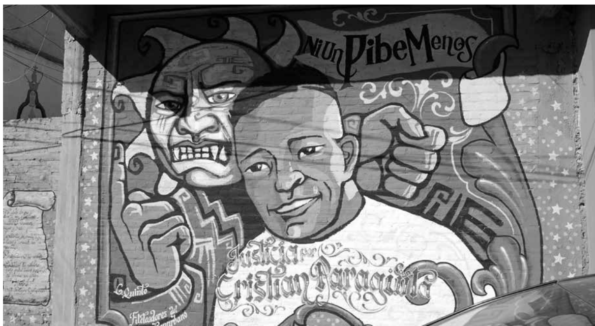
PATRICIO ESCOBAR Y ARTÓ CINE ▶ El documental Antón Pirulero , de Patricio Escobar, hace un recorrido por los mecanismos y el funcionamiento de la “máquina de desaparición forzada en democracia” en Argentina. Producción de Artó Cine con la participación del colectivo FindeUNmundO.

ley penal, por ejemplo, jóvenes con probabilidad de orden de captura, o que sólo se mueven en un mundo de prácticas y mercados informales, como el caso frecuente de la moto “sin papeles”, el consumo de marihuana o la venta informal y callejera de productos variopintos.