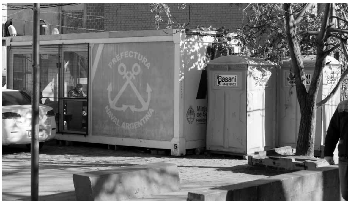
Fotograma del documental Antón Pirulero. Sobre desaparición forzada en democracia (2018), dirigido por Patricio Escobar.

identificar y describir de manera condensada una serie de rutinas y prácticas desplegadas por las fuerzas de seguridad —algunas aceptadas o avaladas en cierta medida por los poderes judiciales y los ministerios públicos—, que producen formas específicas de violencia policial. Es decir, el hostigamiento remite a intensidades de violencia, discrecionalidad y arbitrariedad policial que pueden ser antesala de hechos de violencia más extremos y que constituyen y se incluyen en el repertorio de las formas que adopta la violencia institucional, a modo de subespecie de ese mundo categorial y clasificatorio de registro de las violencias institucionales. La noción de hostigamiento aporta casuística a la gramática de la violencia, que se encarna en prácticas propias de las relaciones entre efectivos de las fuerzas de seguridad y habitantes de los barrios pobres, que se caracterizan por el abuso, el maltrato, la humillación, la arbitrariedad, o lisa y llanamente, la transgresión del marco legal. En ocasiones, pueden