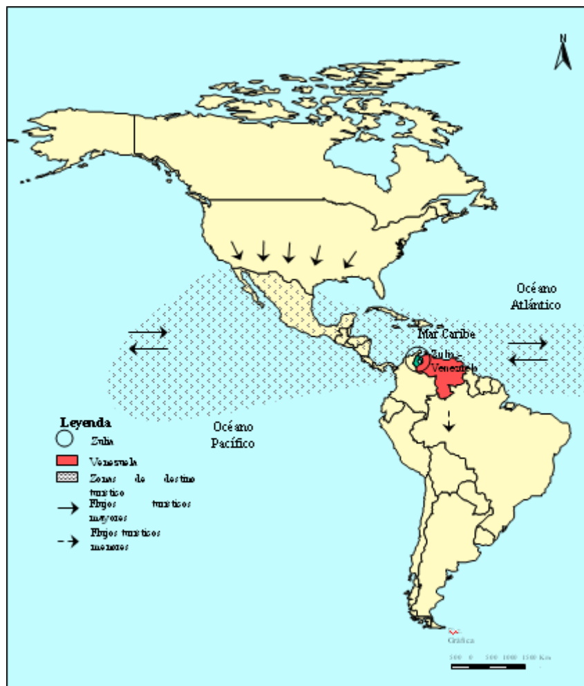
Figura 1: Venezuela y es Estado de Zulia en el contexto del turismo mundial