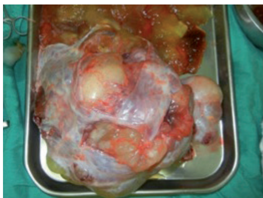
Figura 4. Tumoración de ovario, observándose el material mucinoso

El reporte de patología indica tumoración de ovario de gran tamaño que mide 23 x 18 x 5 cms, ovoide liso, rosado amarillento y seccionado. Con múltiples cavidades quísticas que miden 12 y 5 cm. y elimina contenido mucoide espeso. En otras áreas se identifica material pastoso y pelos. El quiste de ovario de menor tamaño, mide 11x 8 cm, rosado parduzco, blando. Al corte elimina contenido pastoso y pelos, con área dura de 2 cm. Superficie interna lisa. La microscopía reporta paredes de quistes, cuyo estroma fibroconectivo laxo y vascularizado se encuentra revestido por epitelio glandular de tipo endocervical. Se identifican tejidos maduros provenientes de las capas germinales representados por epitelio escamoso, folículos piloso, glándulas sebáceas, figura 5.