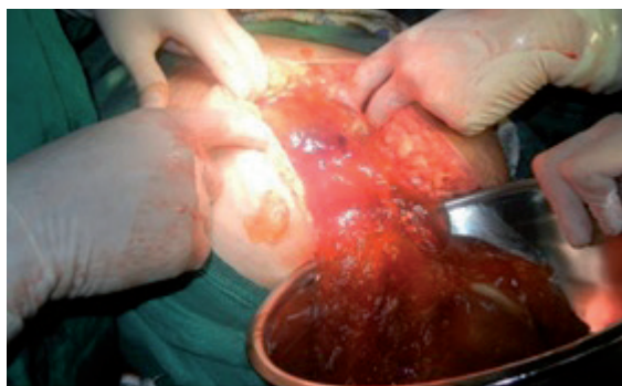
Figura 3. Obsérvese contenido mucinoso.