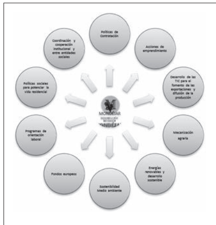
Figura 2. Sinergias para el desarrollo local.

Si ampliamos un poco más la lente, como en la figura 2, podemos incrementar mayores elementos que en su conjunto, de forma coordinada y desde dinámicas de cooperación, podrían obtener mejores impactos en zonas donde se aplique.