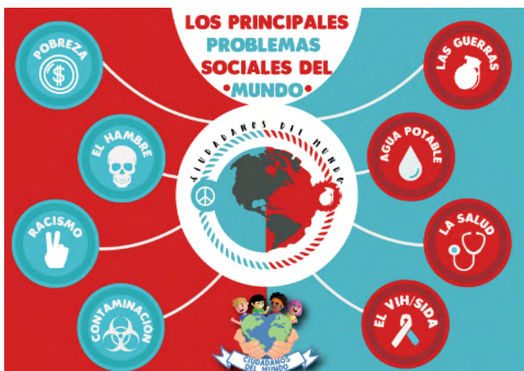
Figura 2. Infografía de estudiantes

Estamos desbordando la copa que contiene una indiferencia destructora. Los problemas que estamos enfrentando globalmente no son solo responsabilidad de una persona, de un país o de un grupo social, ¿qué es lo que estamos haciendo? Estamos solo observando a nuestros “hermanos” destruirse mutuamente como pasa en las guerras sin sentido, observando a los que podrían ser nuestros hijos muriendo por desnutrición, observando cómo la corrupción enriquece a los delincuentes y empobrece al pueblo. ¿Qué nos pasa? Dejemos de observar solamente y callar, los problemas se solucionan aportando así sea solo un granito de arena; los problemas no son de los demás, los problemas son de todos. Así como dijo un filósofo ruso llamado Mijail Bakunin, “Mi patria es el mundo; mi familia la humanidad”.