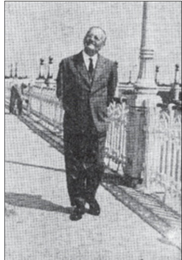
El Barón paseando en San Sebastián.

Lo más importante es dar el “Primer paso” y eso se ha conseguido, y ha sido merced, en gran parte, a la labor personal de un grupo de médicos donostiarras que hemos explotado nuestra amistad profesional con ilustres colegas para conseguir la cesión de las películas. Una labor un tanto romántica si se quiere, pero que puede dar excelentes resultados en ediciones venideras 17 .