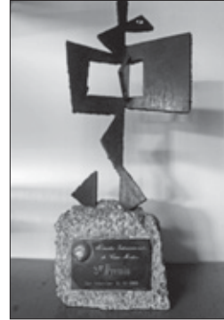
Trofeo que se entregaba.

También la prensa nacional generalista (ABC) se hace eco del acontecimiento: