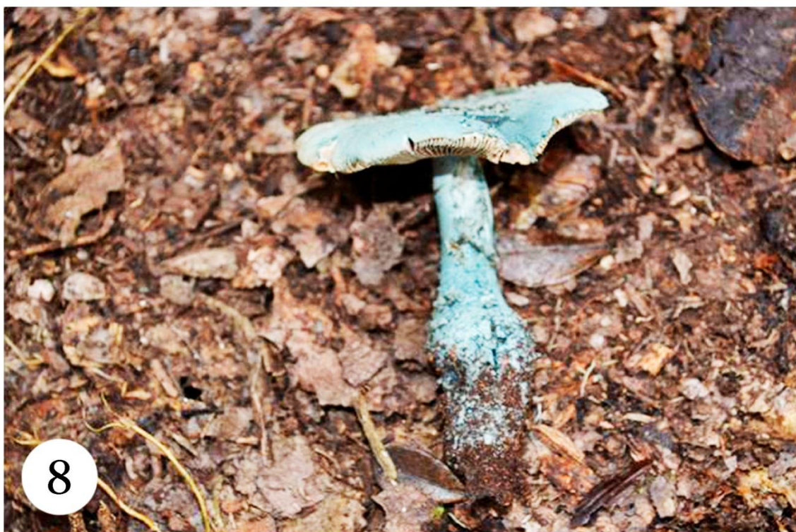
Figuras 7–8. Representantes de Amanita encontrados no Brasil: 7. A. tanacipulvis , espécie oriunda de floresta de campinarana no estado do Amazonas; 8. A. viridissima , espécie recentemente descrita para a região da Chapada da Diamantina, estado da Bahia.