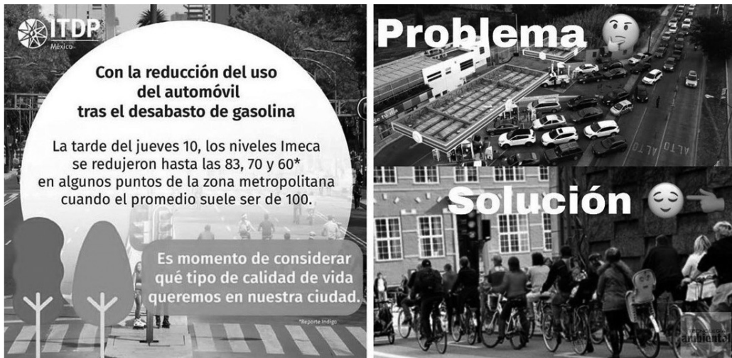
Figura 5 Selección de memes con sentido medioambiental