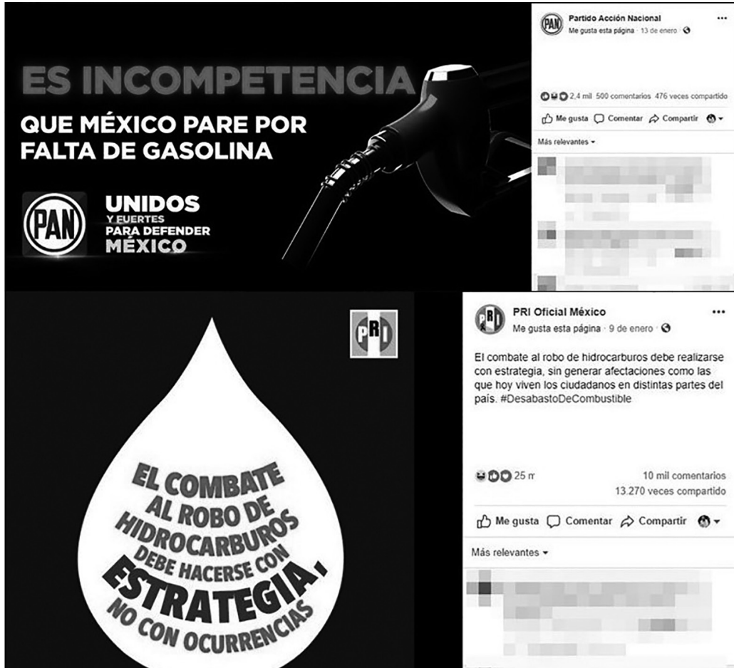
Figura 1 Memes en oposición a las acciones de AMLO: PAN y PRI