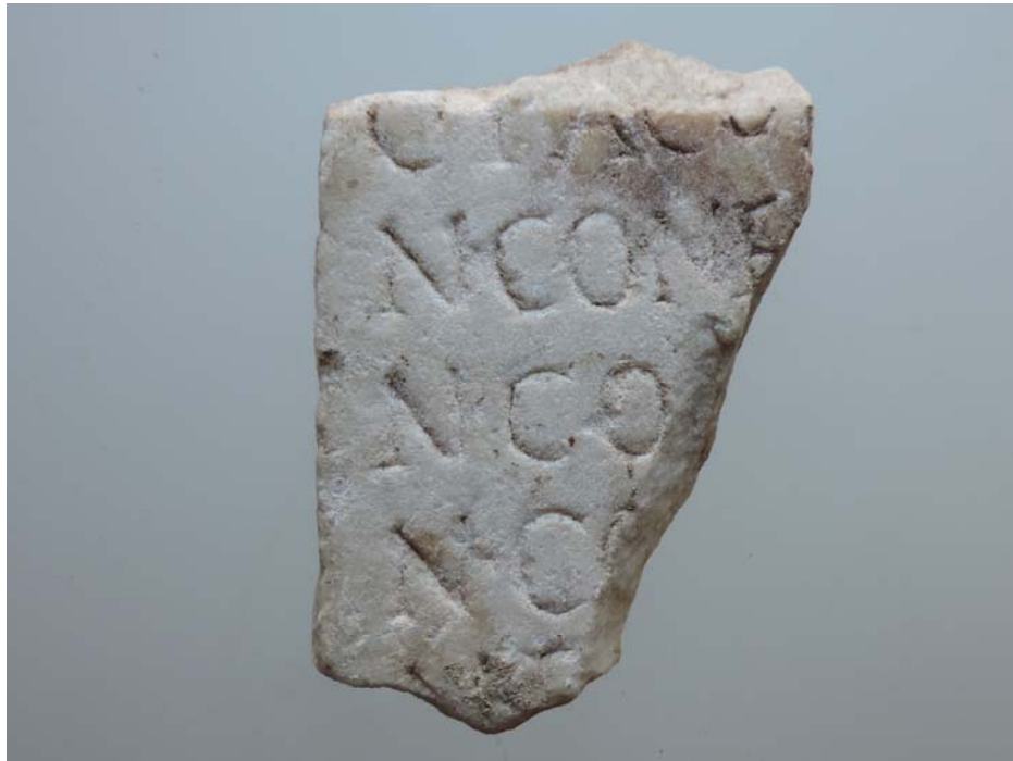
Fig. 2: Iscrizione inedita, Lato A.