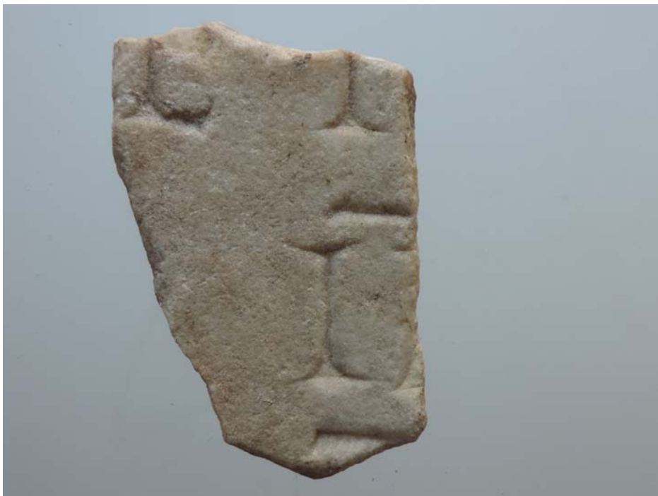
Fig. 3: Iscrizione inedita, Lato B.