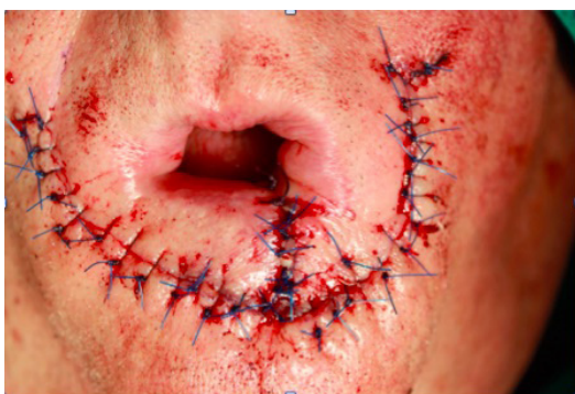
Figura 2. Exéresis tumoral, diseño del colgajo y sutura del mismo.