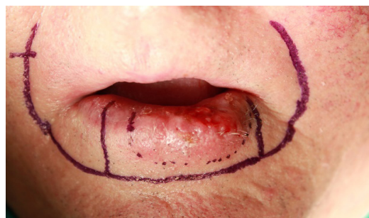
Figura 1. Tumor primario de labio inferior.

La lesión medía aproximadamente 4 cm de longitud total y afectaba a más del 75% de la superficie total del labio inferior. Una biopsia preoperatoria confirmó el diagnóstico de carcinoma epidermoide. Tras la realización de una tomografía axial computadorizada de cabeza y cuello y tórax y constatar la ausencia de metástasis ganglionares cervicales y a distancia, se clasificó el tumor como cT2N0M0 según la clasificación de la American Joint Committee on Cancer (AJCC). Se realizó exéresis tumoral, vaciamiento funcional de las áreas ganglionares I a III bilaterales y reconstrucción del defecto mediante la realización de un colgajo de Karapandzic, según indica la guía de la National Comprehensive Cancer Network [7].