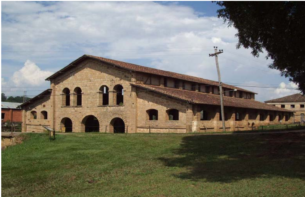
Figura 1: Fábrica de armas blancas – Iperó (Brasil)

Real Fábrica de Hierro de Ipanema: Considerada la primer siderúrgica de Brasil, fue inaugurada en 1818 (Figura 1). Se ubica en el municipio de Iperó, en la Floresta Nacional de Ipanema (FLONA de Ipanema) una unidad de conservación creada en 1992, con un área de 5 mil ha. La fábrica contaba con 8 hornos de 1,5 metros de altura que producían el hierro utilizado en la fabricación de arados, clavos, instrumentos agrícolas, guadañas e, inclusive, armas blancas (espadas, sables y bayonetas). Debido a la llegada de empresas industriales extranjeras cerró en 1895.