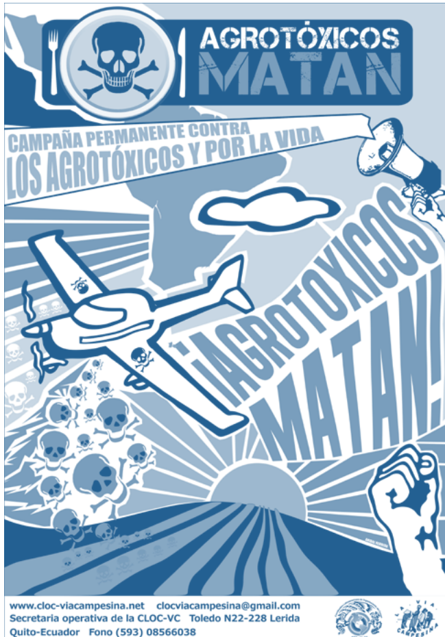
▪ ¡Agrotóxicos matan!, 2011 | CLOC