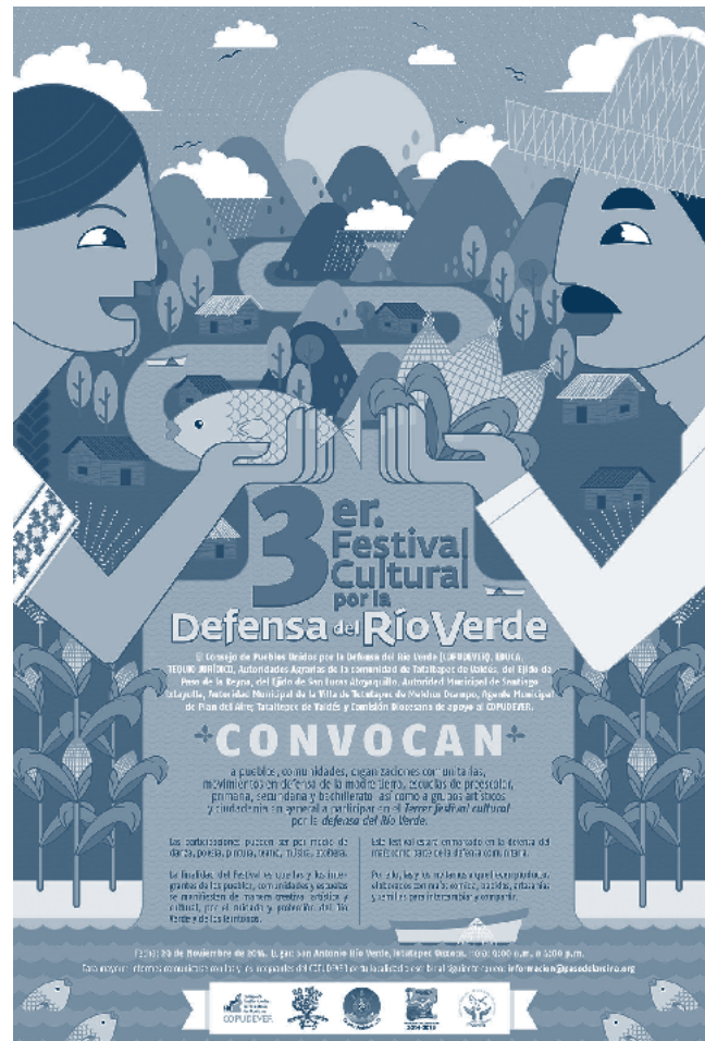
▪ Tercer festival cultural por la defensa del Río Verde, 2014

El Seminario Interdisciplinar de Pedagogía y Saberes hace parte de los últimos semestres del programa de Licenciatura en Educación Básica con énfasis en Humanidades, Lengua Castellana. Su objetivo, desde el 2015, ha sido “explorar y experimentar la inter y transdisciplinariedad en diálogo con problemáticas contemporáneas que afectan e involucran procesos culturales, sociales e históricos de relevancia para la educación y la formación de maestros en el ámbito del lenguaje” (Parra, 2017a: 2), mediante una metodología que articula aspectos del taller y de la pedagogía por proyectos. Por su parte, el curso de Técnicas de la