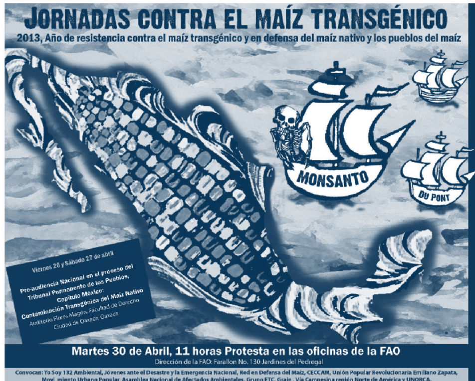
▪ Jornadas contra el maíz transgénico, 2013 | La Vía Campesina

emociones, en tanto dimensiones de la subjetividad sobre las cuales se ha tenido una clara desconfianza. (2001: 299)