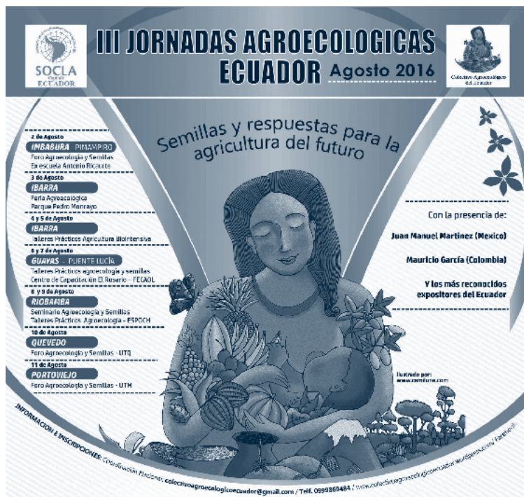
■ Semillas y respuestas para la agricultura del futuro, 2016 | Colectivo Agroecológico Ecuador

Por lo anterior, la continuidad de nuestras experiencias supone relativizar el lugar de la cultura escolar letrada en relación con otros sentidos, expresiones, lógicas y realidades culturales que han estado marginados o relegados en la formación universitaria. Los cuales suelen denominarse y asociarse, por ejemplo, con conocimientos del sentido común, vida cotidiana, oralidad, culturas populares, vida campesina, poblaciones marginales e iletradas, medios masivos de comunicación, entre