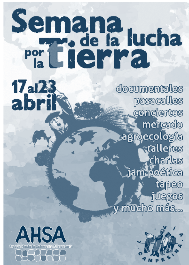
▪ Semana de lucha por la tierra, 2017 | La Vía Campesina, AHSA

Las pedagogías planetarias se posicionan, de manera crítica, en relación con el discurso de la educación y ciudadanía global. Por ello, tales pedagogías expresan saberes y prácticas alternativas frente a la homogenización y el pensamiento único vinculado con la globalización. Al respecto, Rodríguez y Yarza no reducen la pedagogía a una dimensión instrumental o a una acción comunicativa, sino que invitan a “entenderla, sentirla y hacerla a partir de tres dimensiones complementarias que van más allá de las disciplinas” (2016: 62), entenderla como una herramienta que apropia críticamente la educación/aprendizaje global (particularmente, desde sus versiones críticas, progresistas o radicales); como un escenario que permite visibilizar las epistemologías del Sur, desde la sombra de la modernidad; y como un filtro de opciones teóricas y prácticas que opera desde el paradigma de la planetariedad, lo que implica recuperar saberes gestados en el territorio bajo las condiciones de lo propio: