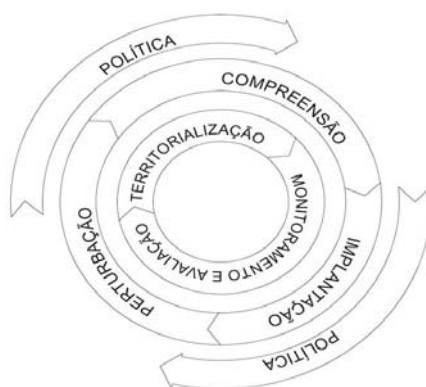
Figura 3: Propuesta de política de planeamiento y gestión de territorios turísticos

La Figura 3, que representa los procesos propuestos por el modelo, demuestra que los procesos de territorialización y de evaluación y monitoreo son primordiales, debiendo ser simultáneos y necesitar un fuerte control del poder público. Los procesos de perturbación del sistema, comprensión e implementación también deben ser simultáneos y necesitan ser completados por etapas de retroalimentación. A nivel macro, la definición y la acción política sirven para identificar las necesidades locales y crear regulaciones.