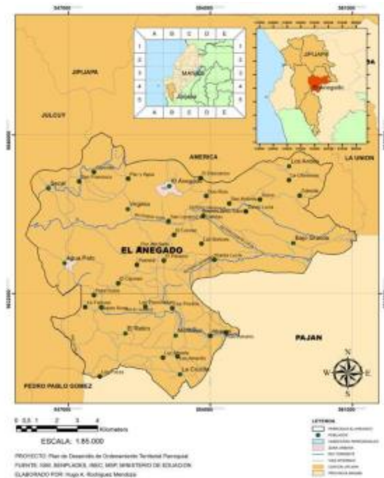
Fig. 1 Mapa de la parroquia El Anegado