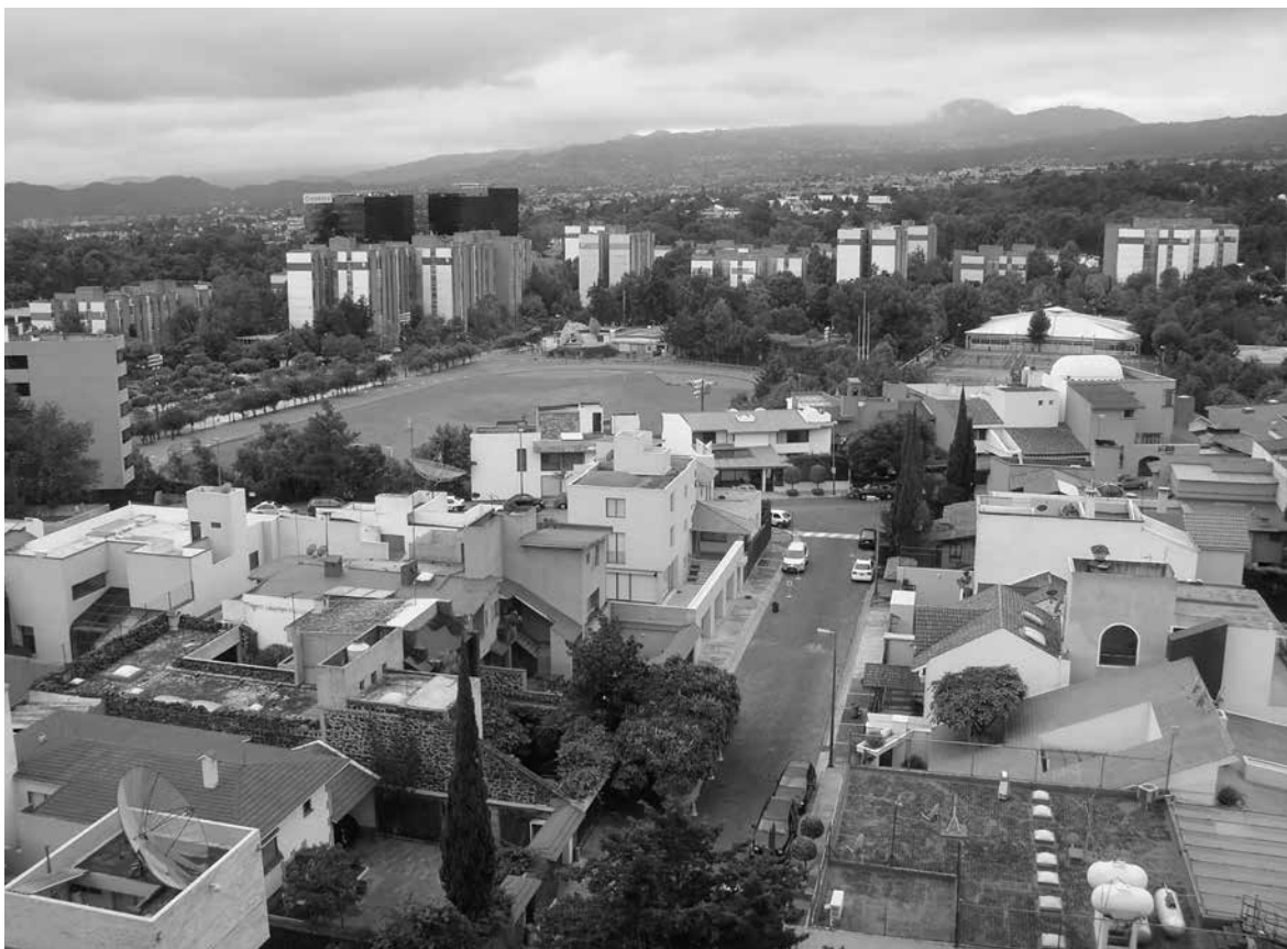
LUCY NIETO ▶ Uno de los primeros fraccionamientos cerrados de elite al sur de la Ciudad de México. Al fondo, el conjunto de condominios Villa Olímpica, octubre de 2008.