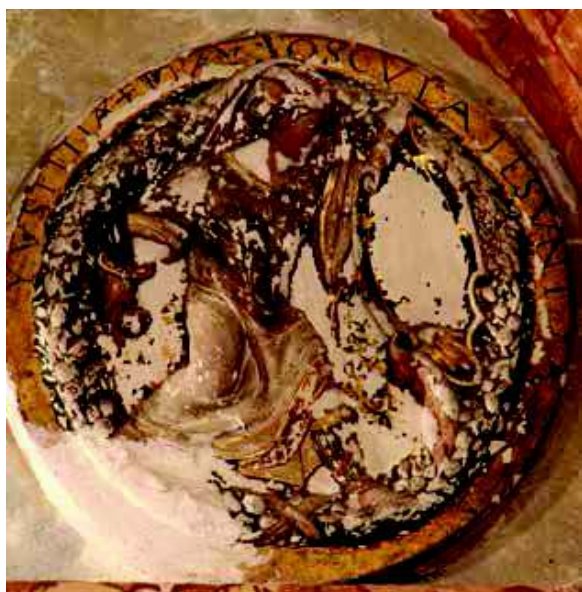
[Fig. 15]

YVSTITIA ET PAX OSCVLATE SVNT ("La Justicia y la Paz se besaron". Salmo 84, 11).