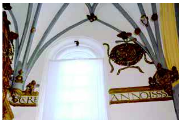
[Fig. 18]

El friso perimetral [Fig. 17], como fue costumbre en otras ocasiones, lo emplearon para noticiar detalles fundacionales, de los que, por fortuna, se conserva la fecha de 1555 [Fig. 18], ya que otra parte fue ocultada por el retablo mayor de Juan de Medina Argüelles (1668), y una más afectada por la apertura de una ventana posterior que la cortó parcialmente, aunque respetó al año en que se hizo la decoración. Dice así: