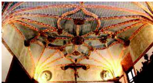
[Fig. 14]

vedas de este ámbito que el doctor Francisco de Espinosa, fundador y patrono de la capilla, promovió en 1550-1551 [Fig. 14].