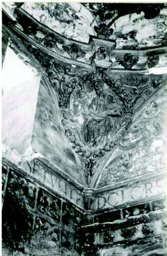
[Fig. 16]

La inscripción funeraria ofrecía la fecha de fallecimiento del patrono, 1561, pues la de su esposa no se pudo llegar a leer. Otro letrero, en este caso por encima de la línea de cornisa, proclamaba una leyenda religiosa de la que en la fotografía solo llegamos a leer estas palabras, suficientes para localizarla [Fig. 16]: