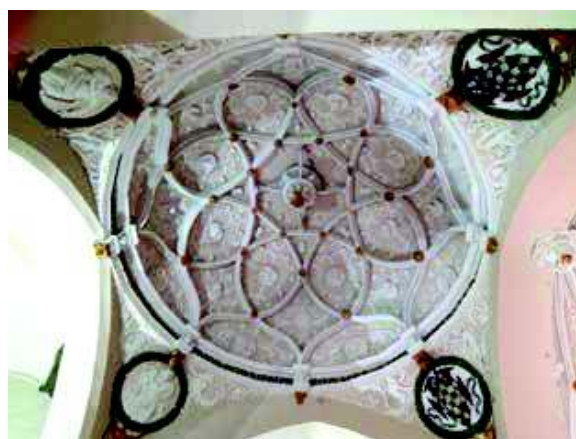
[Fig. 13]

(“Ensalzada eres, santa Madre de Dios, sobre los coros de los ángeles en los celestiales reinos por siempre jamás. Amén”. Traducción al romance de versículo y responsorio para la fiesta de la Asunción: V./ Exaltata est sancta Dei Genitrix. R./ Super choros angelorum ad caelestia magna [...] in aeternum ).