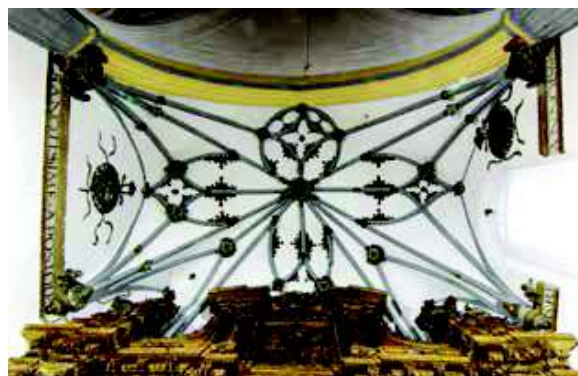
[Fig. 17]

Los hermanos Corral cubrieron con una bóveda estrellada la capilla mayor de este templo, empleando como modelo los moldes realizados para la iglesia de Santa María de Mediavilla, especialmente en la capilla de los Benavente.