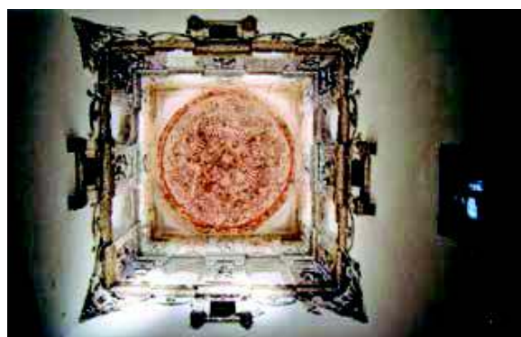
[Fig. 31]

Han de sumarse dos volúmenes más a este cuadrado perfecto, hacia el norte una estancia rectangular que, techada con bóveda de crucería estrellada, servía como capilla, y adosado al muro occidental un cubo cilíndrico donde va la escalera de caracol. Esa imagen de fortaleza a la que se aludía desde antiguo quedó desfigurada en un momento incierto al rasurarse las almenas de las torres angulares y de la linterna central (lo que además le resto airoso y movimiento), pero sobre todo al recrearse los cuerpos intermedios hasta la altura de las anteriores para obtener nuevos espacios practicables [Fig. 31].