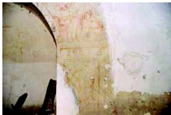
[Fig. 32]

Los hermanos Corral de Villalpando ya habían trabajado para la familia Dueñas en la fundación monástica que pocos años antes habían auspiciado en la ciudad de Medina del Campo, el monasterio de Agustinas de Santa María Magdalena. Terminadas las obras para las monjas, un año después, en 1559, los artistas y su taller se trasladaron a la Casa Blanca para ocuparse de sus yaserías durante los años inmediatamente posteriores, y hubo de concluirse no antes la fecha que leemos en una cartela pintada en la jamba de un vano de la planta baja [Fig. 32]: