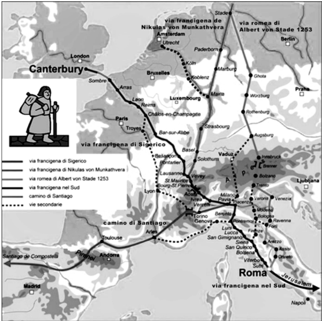
MAPA 1. VÍAS DE LOS ANTIGUOS PEREGRINOS EN EUROPA.