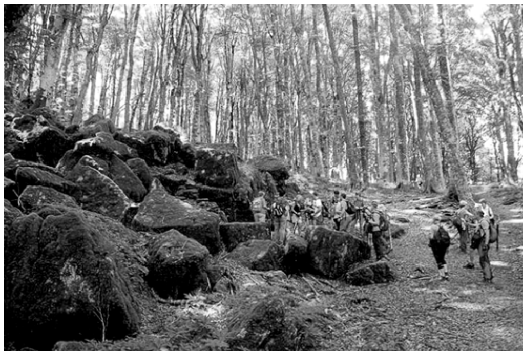
FOTO 1. EXCURSIONISTAS EN EL PARQUE NACIONAL DE LAS FLORESTAS CASENTINESI.

ambiental de los aspectos del alojamiento ( residuos, consumo de agua y energía, emisiones de CO 2 , alimentos biológicos , y otros). El proyecto se desarrolla en una vasta área geográfica y se considera un modelo bueno y fácil de aplicar por otras instituciones en el ámbito de las peregrinaciones.