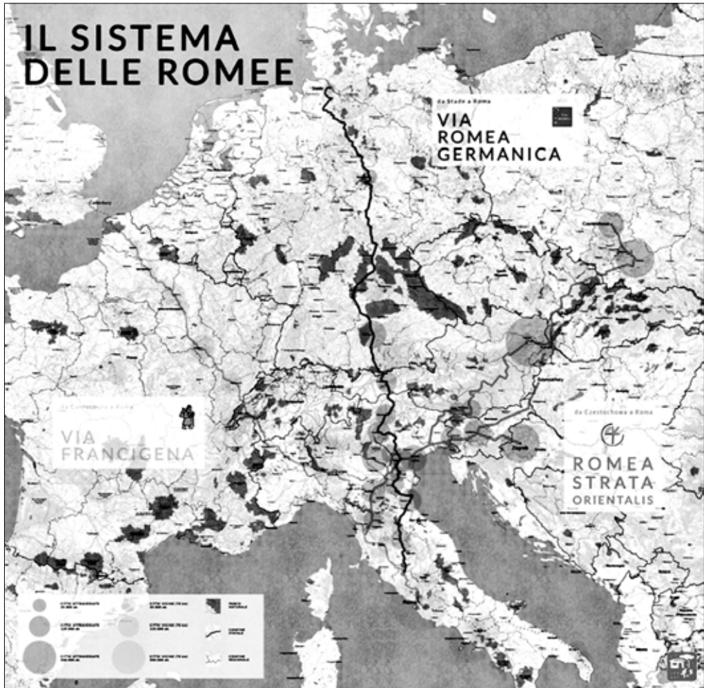
MAPA 2. EL SISTEMA EUROPEO DE LAS VÍAS ROMEAS.