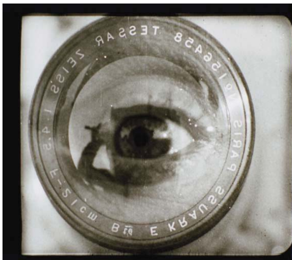
El hombre de la cámara. Dziga Vertov.

El cine, no solamente el documental, es también documento sobre épocas históricas, filosofías y pensamientos, modos de vida y costumbres. A partir del cine debe buscarse la realidad que existe tras la ficción o la ficción que se da tras la realidad. El interés que entraña el cine, su magia y su belleza, la versatilidad de sus técnicas y la infinita gama de contenidos es, en muchas ocasiones, la clave de la investigación sobre otras épocas, historias, relatos o documentos, o sobre el mismo cine, su lenguaje y su tecnología.