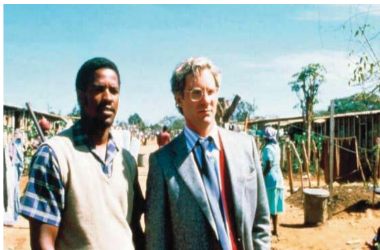
■ Grita libertad. 1987