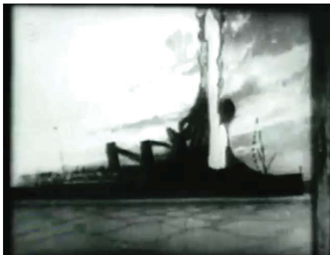
The sinking of Lusitania. 1915

El cine fue el primer medio que usó la imagen en movimiento para hacer periodismo, hasta que fue sustituido por la televisión