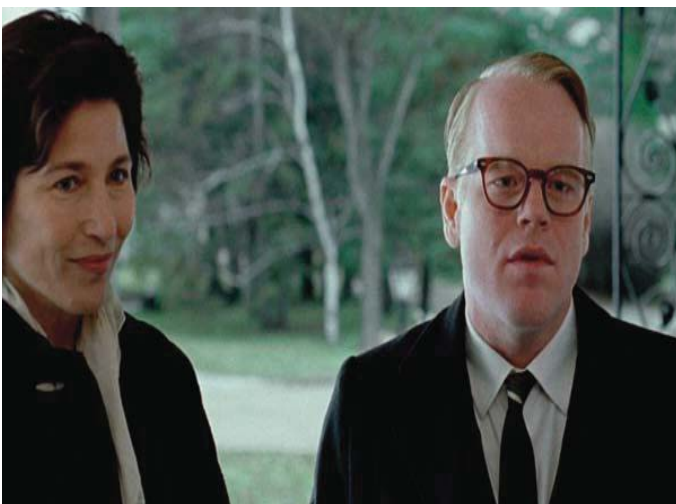
■ Capote. 2005

La trama transcurre entre 1959 y 1965, y narra un fragmento de la vida del escritor cuyo nombre da título a la película, a raíz del asesinato múltiple de una adinerada familia granjera en Kansas, acontecimiento que desembocaría en la publicación en 1966 de A sangre fría .