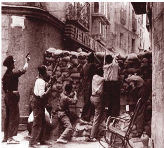
Tierra de España. Joris Ivens (1937)