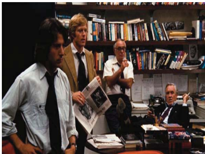
■ Todos los hombres del presidente. 1976

Un grupo mediático, consciente de la importancia de abrir el camino a la verdad, lucha con todas sus fuerzas contra la censura