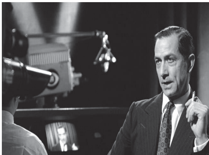
■ Buenas noches y buena suerte. 2005

Por una parte, un ejército de técnicos tratan de salvar a un hombre atrapado en las entrañas de la Tierra. Para ello Tatum pacta con el sheriff (Ray Teal), que