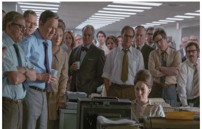
■ The Post. 2017