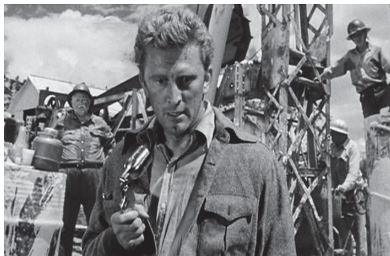
■ El gran carnaval. 1951