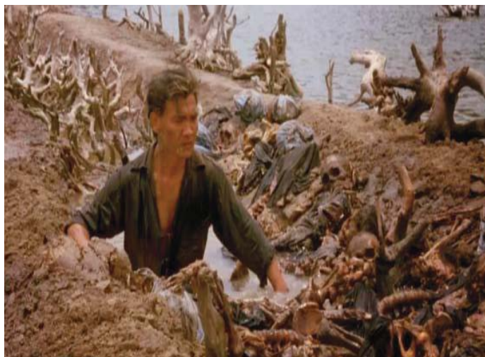
■ Los gritos del silencio. 1984

Attenborough narró la película desde la perspectiva de Donald Woods pues «Si haces una película cen-