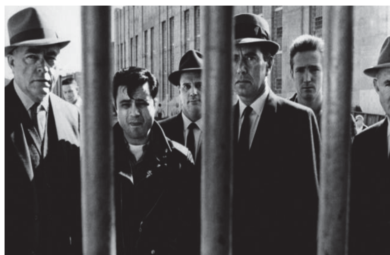
■ A sangre fría. 1967