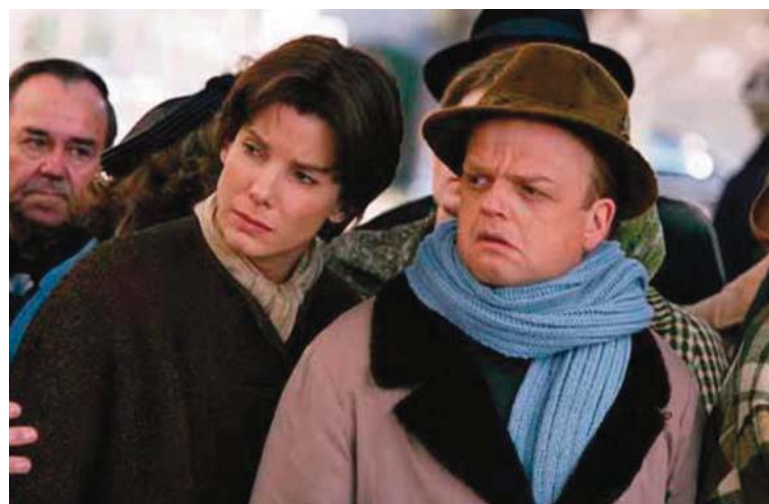
■ The infamous. 2006.