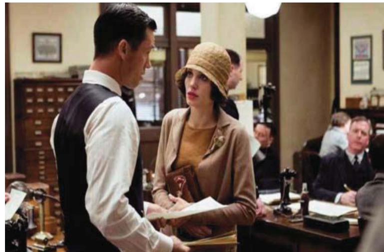
■ El intercambio. 2017