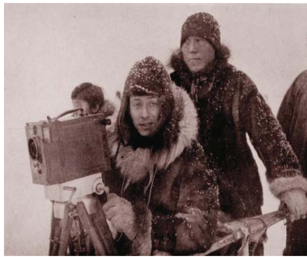
Robert Flaherty. Filma Nanook el esquimal