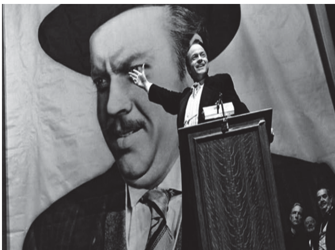
Ciudadano Kane. 1941

El cine ha reflejado en varias ocasiones el papel de los magnates de la prensa. El más significativo, William Randolph Hearst