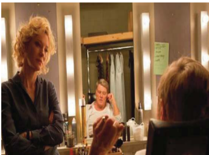
■ La verdad. 2015

Los periodistas, los medios y el público deberán acostumbrarse al periodismo de filtración, pues no es el futuro, sino el presente