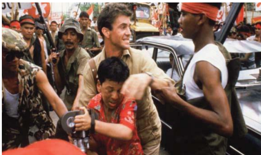
■ El año que vivimos peligrosamente. | 1982