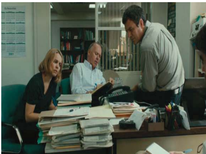
■ Spotlight. 2015

El guionista J. Michael Straczynski, había trabajado para Los Angeles Times , The Herald Examiner y Time , entre otras publicaciones, y hace unos años descubrió la asombrosa historia de la mujer que detuvo la maquinaria política de la ciudad. La olvidada lucha de esta mujer trabajadora para encontrar a su hijo desaparecido hizo que, casi 80 años después, cineastas de Hollywood, en 2008, se decidieran a contar su historia.