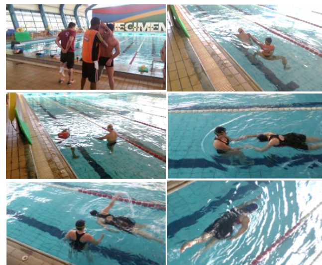
Figura 2. Interação dos acadêmicos como tutores com os atletas com deficiência

Os tutores receberam orientações do técnico de natação adaptada no início do treinamento e desenvolveram as atividades de tutoria conforme programado. As atividades constavam de apoio, acompanhamento e correção dos atletas com deficiência física (Figura 2).