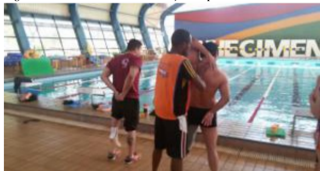
Figura 1. Piscina do treinamento natação adaptada

O projeto de tutoria em natação adaptada foi desenvolvido em uma piscina coberta e aquecida, da universidade participante (Figura 1).