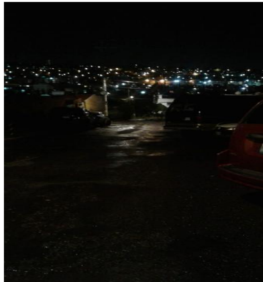
Ilustración 2: Estacionamiento.

Así las luminarias apropiadas al uso y dimensiones del espacio colaboran directamente en la reducción de los delitos de oportunidad y la percepción de temor, ya que el delincuente evita ser visto, y el usuario del espacio público siente mayor control sobre este si es capaz de observar con un campo visual profundo y despejado (p.7).