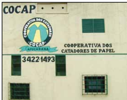
Figura 1: Dependências da COCAP