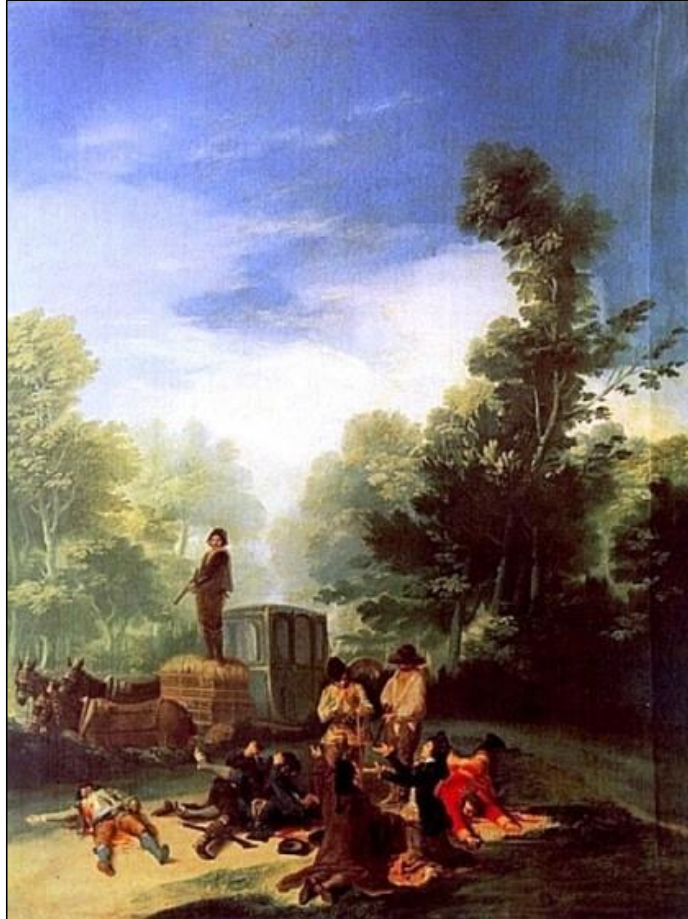
Asalto al coche, 1787, por Francisco de Goya.

Hasta ahora habíamos hablado sobre los viajes en diligencia de viajeros y los peligros de accidente por vuelco, pues bien, ahora vamos a hablar del peligro de asalto de las diligencias y robo de los viajeros por los bandoleros.