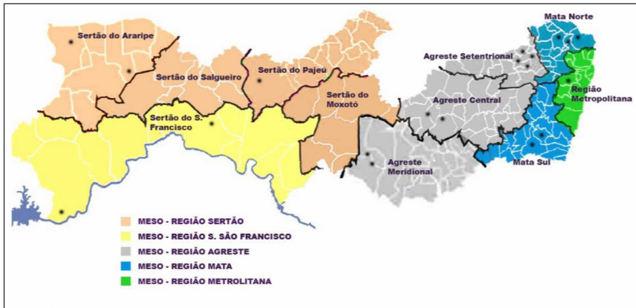
Mapa 1 - Mapa de Pernambuco destacando com círculos na cor preta os municípios contemplados com os CERUs