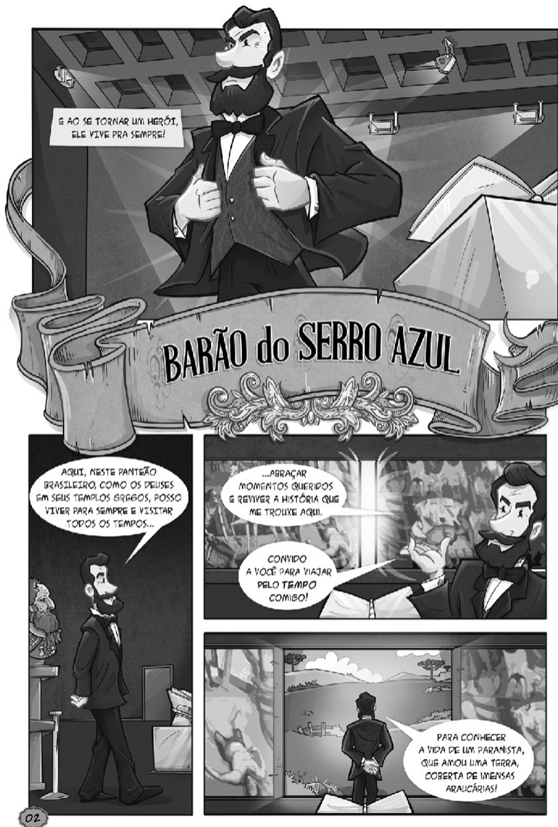
Figura 2 - Quadrinho Barão do Serro Azul: herói da paz – Apresentação do personagem