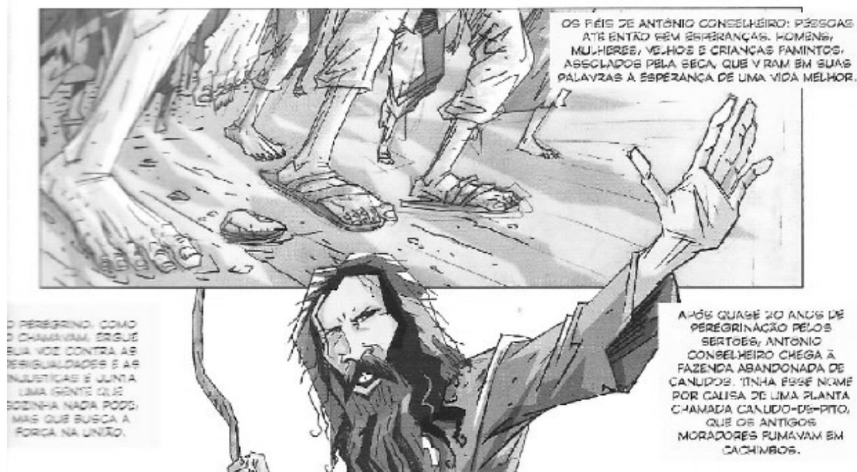
Figura 6 - Quadrinho A Revolta de Canudos – Apresentação do personagem

Nogueira adverte que, mesmo “[...] apesar de um produto comercial, os quadrinhos da coleção [Escala Educacional] trazem conteúdos básicos que podem ser aprofundados durante as aulas de história” (NOGUEIRA, 2012, p. 15). Isso reforça a ideia de que, mesmo o quadrinho possuindo um caráter didático-educacional, é necessária a mediação de um professor para o estudo da questão, pois, na narrativa, é induzido um cenário dicotômico do conflito, a República de um lado, e Antônio Conselheiro de outro. Assim, o professor cumpriria o papel de demonstrar outras forças de ação e aprofundar a discussão – trazendo o embate entre sertanejos e grandes proprietários de terra, o papel da igreja e seu alinhamento com a república – inclusive evocando como as personagens são apresentadas (Figura 6). Nesse sentido, pode-se questionar se o Conselheiro é representado como herói ou anti-herói.