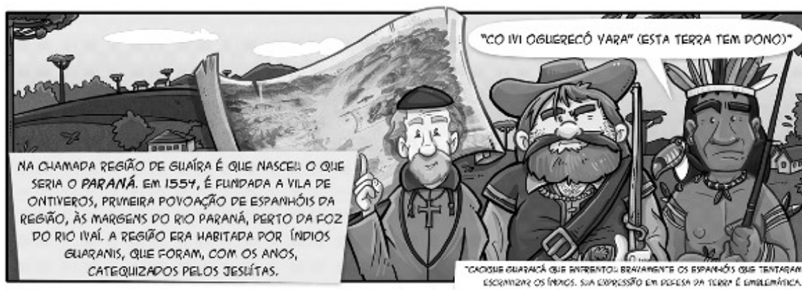
Figura 3 - Quadrinho Barão do Serro Azul: herói da paz – Representação dos indígenas

A narrativa do quadrinho realiza um ambicioso apanhado cronológico da história do Paraná, que parte do século XVI com a chegada da expedição do aventureiro espanhol D. Álvaro Cabeza de Vaca, e, em quatro páginas, avança até Paranaguá de 1845, local e ano do nascimento do Barão do Serro Azul. Vale destacar que a primeira página dessa história é a única passagem em que um indígena é representado, e, ainda, de maneira bastante caricata, com um cocar colorido e um tucano no ombro (Figura 3). Apenas há menção nominal ao grupo Guarani, ignorando as diferentes etnias que habitavam as terras então retratadas. Mais adiante, eles serão mencionados pela segunda e última vez em um quadrinho sobre os usos da erva-mate que viria a transformar a economia local.