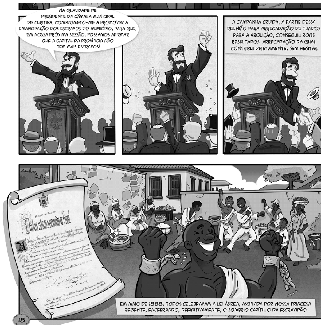
Figura 4 - Quadrinho Barão do Serro Azul: herói da paz – Representações da abolição