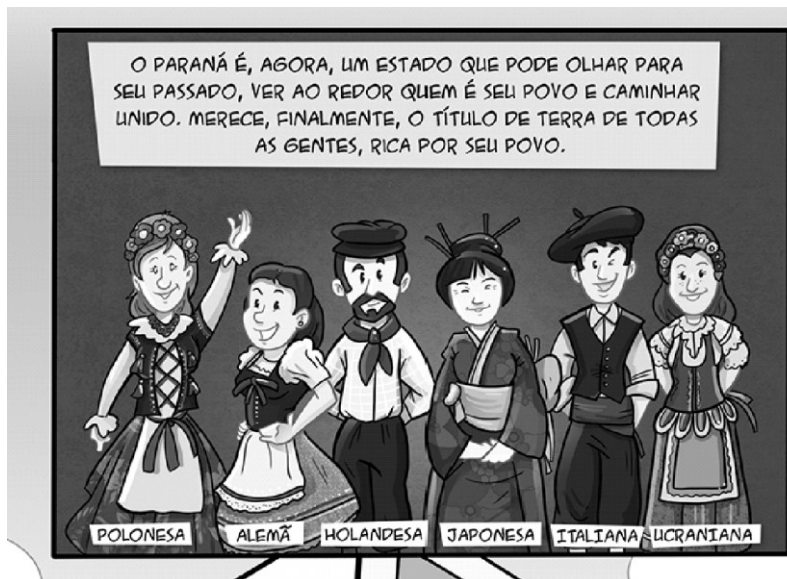
Figura 5 - Quadrinho Barão do Serro Azul: herói da paz – Delimitação dos herdeiros do Paraná

Também sugerimos que o professor aborde a história indígena, apresentando fotografias das etnias Kaingang, Xetá e Guarani e suas produções (esculturas, instrumentos, tecelagem e adornos), mostrando como a terra hoje chamada Paraná não era um grande campo desabitado esperando a intervenção dos europeus para se desenvolver, mas abrigava povos culturalmente diversos. Sob essa mesma perspectiva, ressaltar que esses povos não desapareceram, embora em quantidade brutalmente diminuída existem indígenas e reservas no estado do Paraná. Pode-se mencionar, também, povos extintos antes mesmo da chegada dos europeus, como o caso dos sambaquieiros. Nesse sentido, o professor tem a oportunidade de apresentar dissonâncias com relação à narrativa do quadrinho que, sob o discurso da pluralidade de povos (Figura 5), sustenta o tradicional preconceito do Paraná como uma terra de pessoas brancas, a Europa do sul.