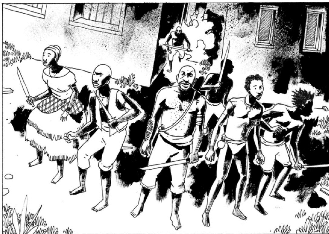
Figura 8 - Quadrinho Cumbe – Apresentação dos personagens em coletividade

Nesse sentido, a resistência e a subversão do arranjo social tal como é forjado são representadas em sua dimensão coletiva, como se a substância heroica presente em um superindivíduo se encontrasse difusa entre muitos escravizados. É importante que se aponte, contudo, que o coletivo em Cumbe não se apresenta como uma massa indiferenciada, um grupo movido por objetivos exatamente iguais, com o mesmo ímpeto e coragem. Há a preocupação em detalhar os agentes dessas resistências cotidianas, explorar as profundidades e as contradições dos personagens, legando contornos mais nítidos ao sujeito histórico. Mesmo quando aborda um levante em grupo (Figura 8), D'Saleta tem a preocupação de delinear as individualidades dos escravizados, inclusive a partir de conflitos e de tensões entre eles próprios. Em uma das passagens, alguns escravizados organizam-se em rebelião, juntando facas e adagas para o combate. Mesmo nos quadrinhos em que o grupo é retratado, o leitor não deixa de perceber as diferenças entre cada escravizado, uma vez que suas trajetórias são trabalhadas em páginas anteriores. Trata-se de um retrato que assume a relação dialética entre indivíduo e coletivo, a individualidade que se diferencia de um todo homogêneo, mas que é, em alguma medida, informada e influenciada pelo caráter coletivo.