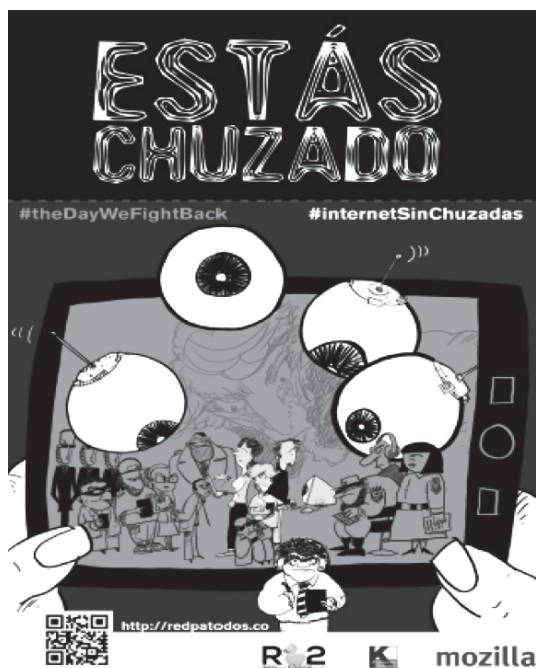
Ilustración 2. Afiche “Estás chuzado”.

Mi tiempo en la EFF transcurrió en esa pequeña oficina, donde no podía dejar de pensar que posiblemente la mejor manera de entender el tra-