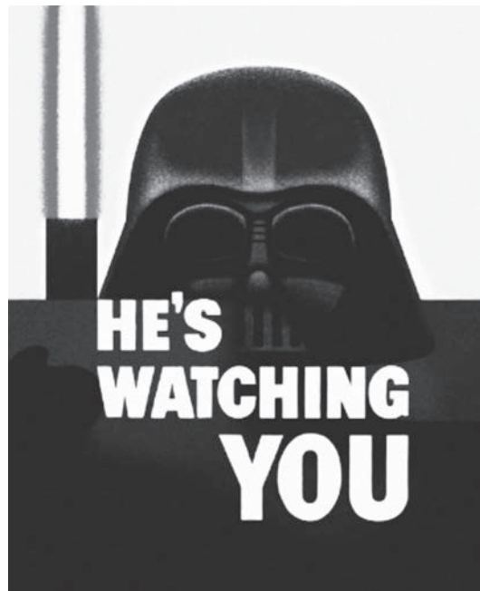
Ilustración 1. Afiche original y afiche ilustrado.