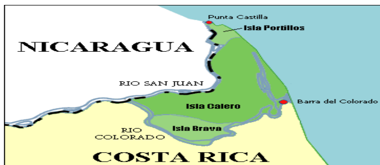
Figura 2: Bifurcación del río San Juan en dos brazos: San Juan inferior y río Colorado, y situación geográfica de la Isla Portillos.

situada a una veintena de kilómetros al Sureste de la desembocadura del San Juan inferior (ver figura 2). Actualmente, el Colorado transporta alrededor del 90% del caudal total del San Juan, mientras que el 10% restante discurre por el San Juan inferior.