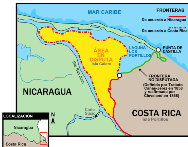
Figura 3: Situación geográfica de la laguna Los Portillos y el territorio litigioso.

El territorio situado entre el río Colorado y el curso inferior del río San Juan se designa con el nombre de Isla Calero (150 km 2 ), y engloba una zona más pequeña situada al Norte que Costa Rica denomina Isla Portillos y Nicaragua Harbor Head (17 km 2 ). En la parte septentrional de Isla Portillos se encuentra la laguna denominada por Costa Rica Los Portillos y Harbor Head por Nicaragua (ver figura 3), actualmente separada del mar por una formación arenosa. Isla Calero forma parte del Humedal Caribe Noroeste , designada el 20 de marzo de 1996 Humedal de Importancia