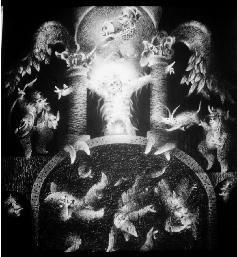
Figura 1. Hombre . Dimensiones: 60 X 65 cm. Técnica carboncillo.

entre la vida y la muerte. Entre el nacer y el morir. Entre el blanco y el negro. La luz y la sombra. En sus espacios, en sus submundos. En sus espacios con sus cargas emocionales que a veces lo hacen caer o lo elevan en contextos complejos, en contextos oscuros.