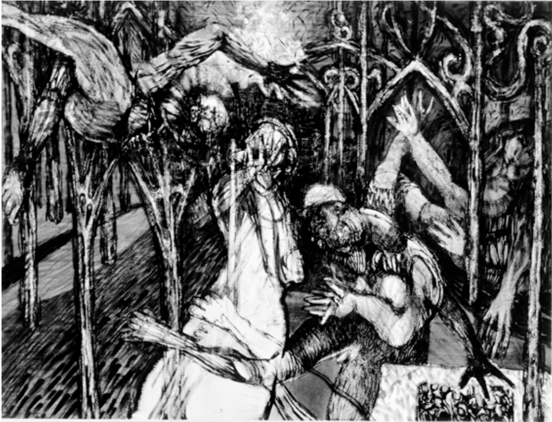
Figura 5. El escape de los íconos Dimensiones: 50 X 65 cm. Técnica aguada.

lo que van a encontrar, porque sus brújulas se han perdido, se convierten en migrantes.