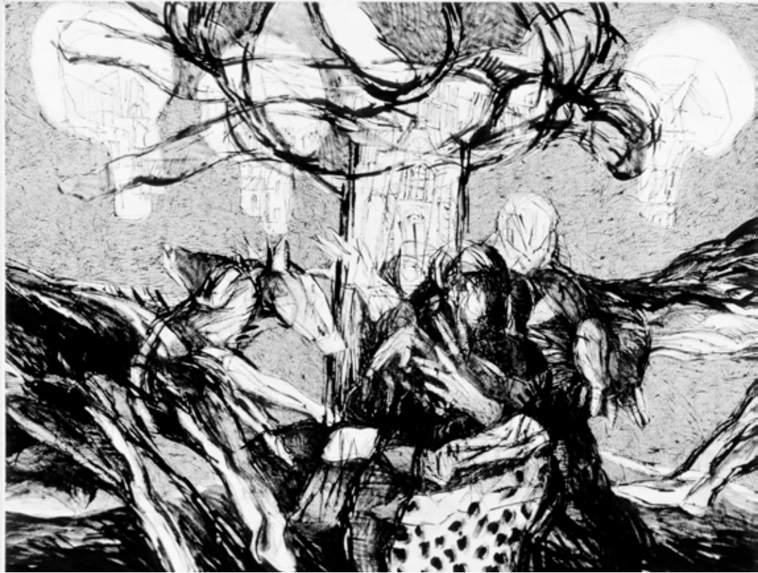
Figura 7. Ilusiones Dimensiones: 50 X 65 cm. Técnica: pincel seco.

elaborar una cronología o etapas. Para Celso, el año de elaboración es secundario, no forma parte de la obra. Por esta razón denominó “Atemporal” a la exposición inaugurada en la ciudad de Ibarra el 20 de abril del 2018.