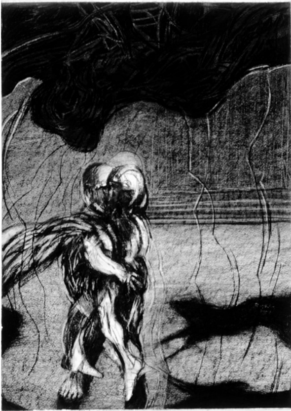
Figura 3. Serie ángeles y demonios. Caminata de la Soledad . Dimensiones: 55 X 75 cm. Técnica carboncillo.