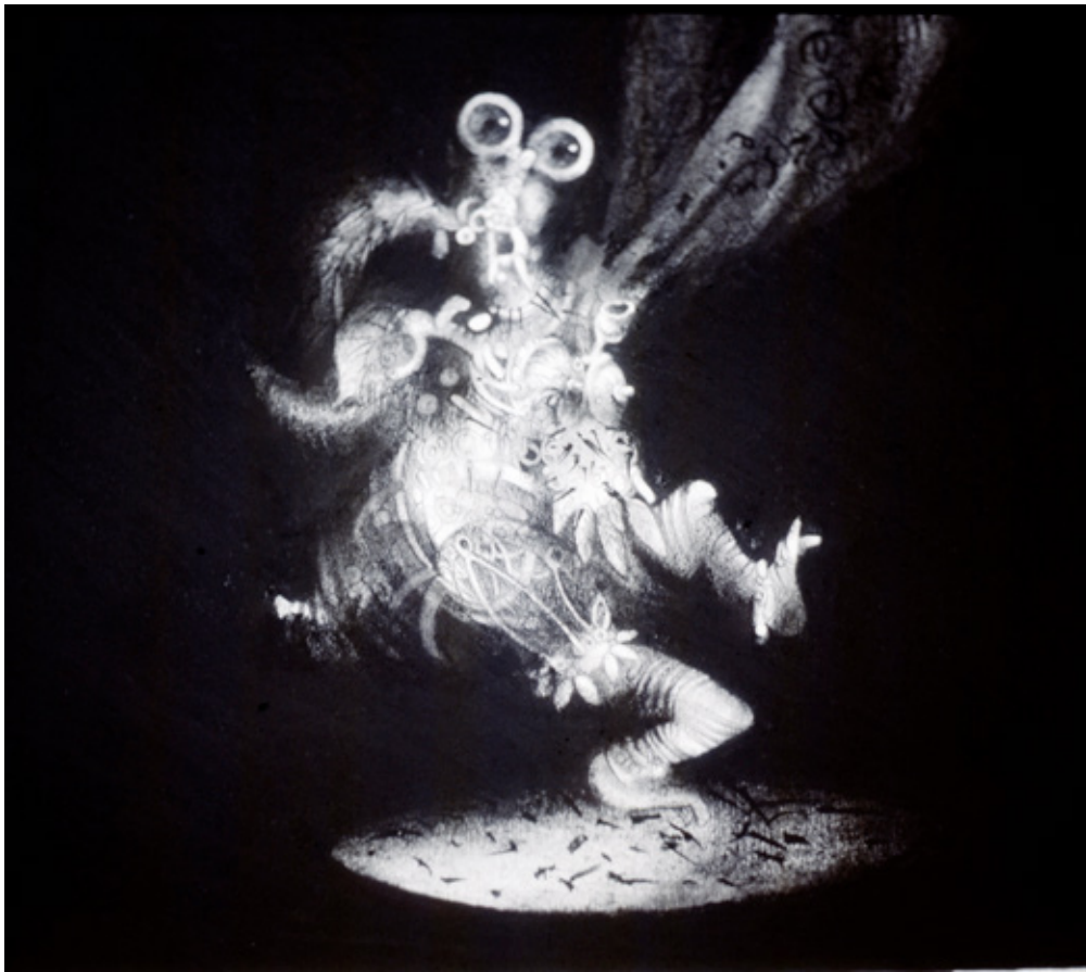
Figura 2. CINIFE Dimensiones: 35 X 35 cm. Técnica carboncillo.

CR: Creo que simplemente es el ser humano en su anonimato. Son lo que son y reinan en su espacio. Esto hace que en cierta medida la obra se universalice.