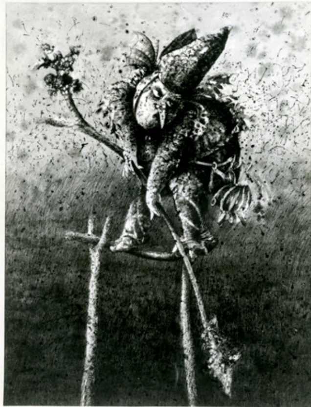
Figura 6. El pescador de ilusiones Dimensiones: 100 X 150 cm. Técnica: tinta sobre lienzo.