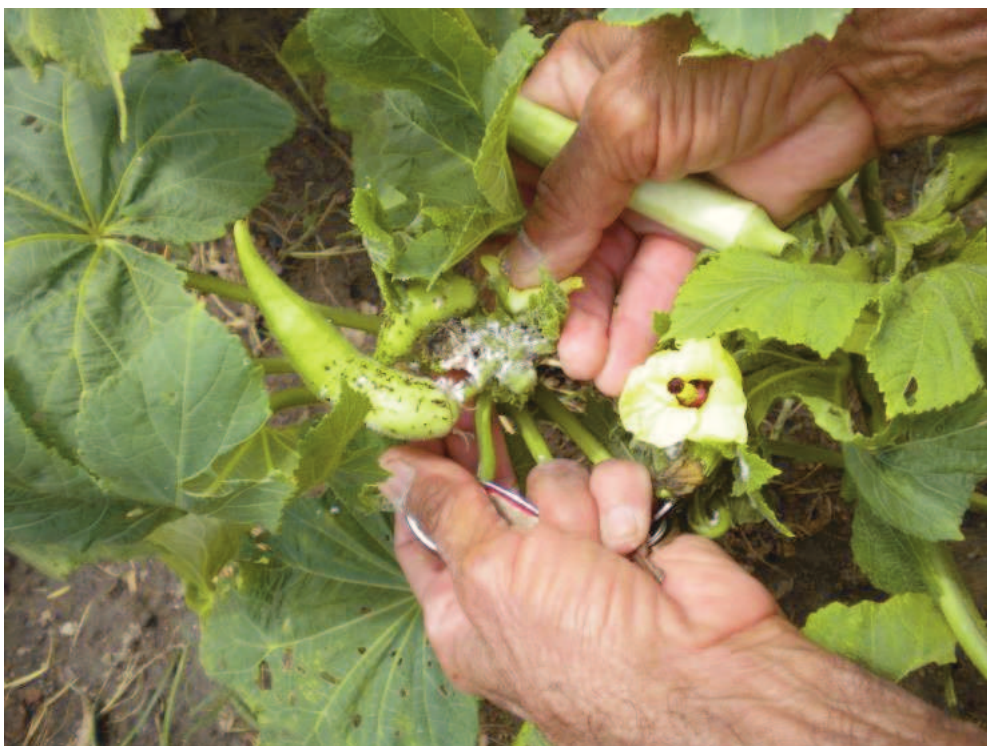
FIGURA 2: Mofo em quiabo, solto pela formiga, segundo agricultor*.

e ficava exposto quando ele retirava a cera branca das cochonilhas.