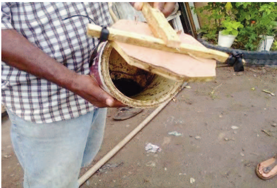
FIGURA 3: Fojo confeccionado por agricultor*.

A caça com cães domésticos é popularmente difundida devido à facilidade que os cães têm de interpretar os comandos humanos (SAMPAIO et al., 2012). No ambiente urbano a caça a roedores com auxílio de cães foi observada no estado da Paraíba (BARBOSA et al., 2008) e na região Norte Fluminense (SAMPAIO et al., 2012). Um estudo sobre os caçadores do semiárido nordestino aponta que a atividade de caça com cães é muito utilizada em ambientes rurais, inclusive na zona semiárida do Nordeste brasileiro (ALVES et al., 2009). É uma atividade que proporciona, entre outras coisas, o melhoramento de aquisição proteica e o controle de predadores (VASCONCELOS NETO et al., 2012).