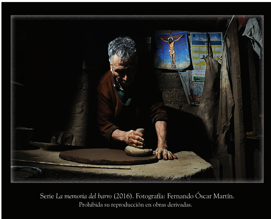
Serie La memoria del barro (2016). Fotografía: Fernando Óscar Martín. Prohibida su reproducción en obras derivadas.

FERNANDO ÓSCAR MARTÍN. Artista especializado en fotoperiodismo y antropología visual, con más de cincuenta exposiciones individuales y colectivas en México y otros países. Obtuvo el primer lugar en los siguientes certámenes: el Concurso Nacional de Fotografía Antropológica e Histórica de la ENAH “Visiones actuales de la Independencia y la Revolución en México”, durante el año del Bicentenario y Centenario de las mismas; el Concurso Latinoamericano FOCO OAXACA; el Concurso Nacional de la Alianza Francesa; el Concurso Nacional “Paisajes de México bajo la lente”, convocado por el Museo Franz Mayer de México; y el Concurso Estatal de Fotografía “Artesanía Mexiquense”. Ganó el segundo lugar del Festival Internacional de Documentales Santiago Álvarez, de Santiago de Cuba. Fue finalista de la beca EFTI “Roberto Villagraz” de Madrid, España. Obtuvo mención honorífica en el Certamen PCI (Patrimonio Cultural Inmaterial) de Latinoamérica, en Perú, y el tercer lugar en el Concurso internacional de fotografía Sony (WPO). Ganó la beca FOCAEM 2012 para Jóvenes Creadores, y la misma beca para creadores en 2013 y 2014. Consiguió el segundo lugar en el Concurso Estatal de Fotografía “Mi oficio, mi trabajo, son mi orgullo”. Recibió la Presea Metepec 2015 en Periodismo y/o Información.