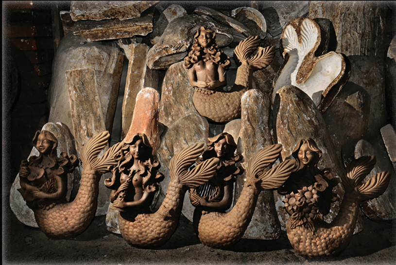
Serie La memoria del barro (2016). Prohibida su reproducción en obras derivadas.