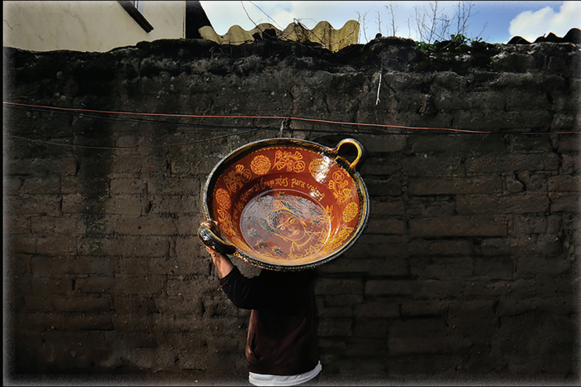
Serie La memoria del barro (2016). Fotografía: Fernando Óscar Martín. Prohibida su reproducción en obras derivadas.