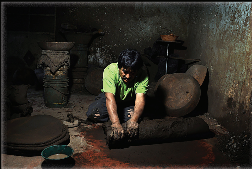
Serie La memoria del barro (2016). Fotografía: Fernando Óscar Martín. Prohibida su reproducción en obras derivadas.