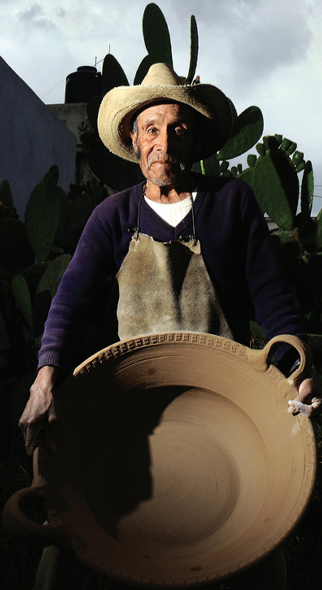
Serie La memoria del barro (2016). Fotografía: Fernando Óscar Martín. Prohibida su reproducción en obras derivadas.