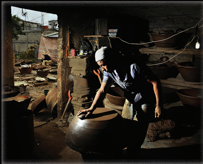
Serie La memoria del barro (2016). Fotografía: Fernando Óscar Martín. Prohibida su reproducción en obras derivadas.