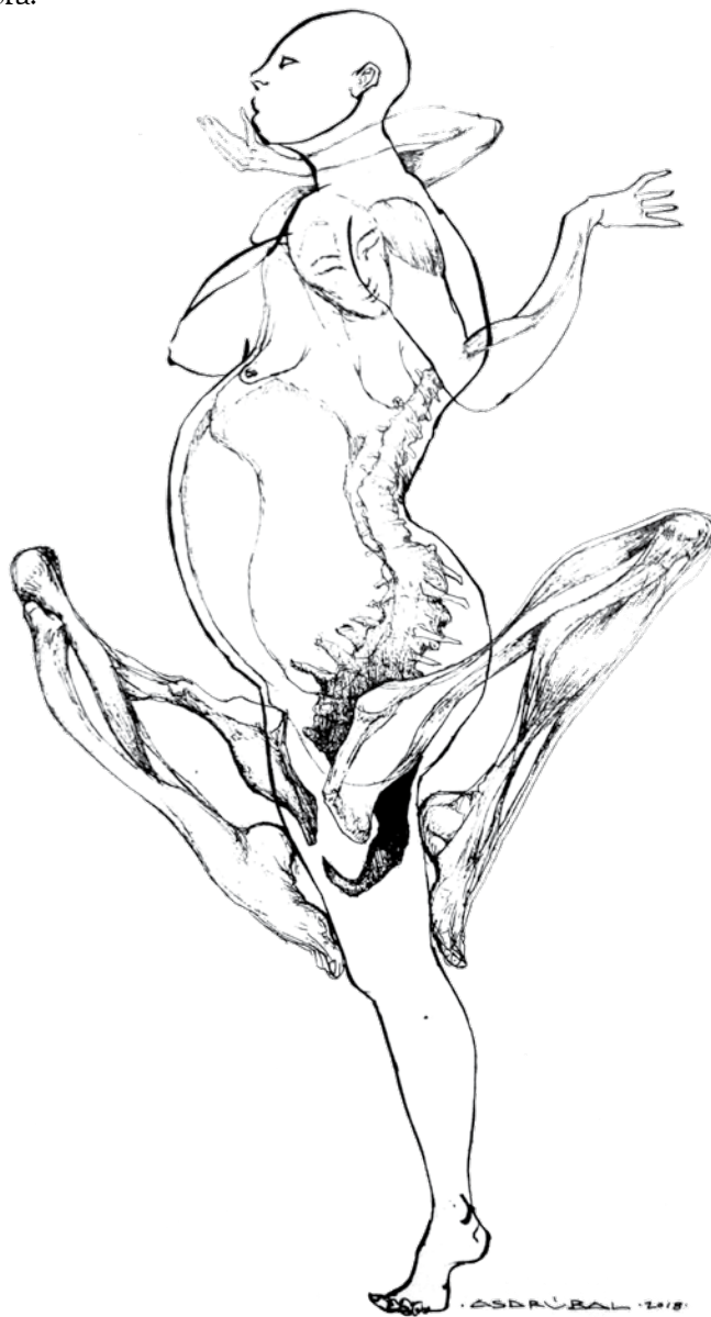
Sin título (2018). Tinta sobre papel: Asdrúbal Max Morales. Prohibida su reproducción en obras derivadas.

Negra piel donde se acarician las flores ahí nada regresa. En el río danza su sombra.