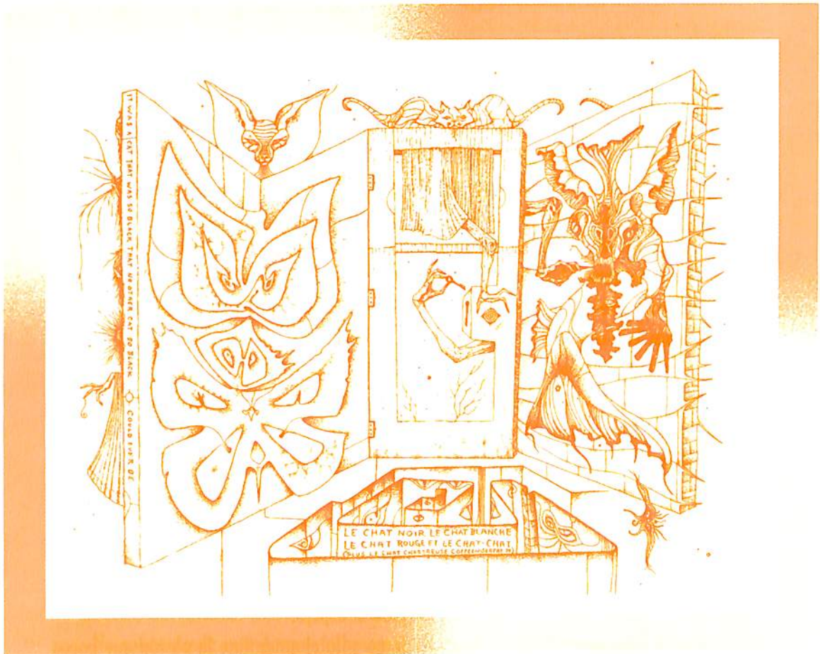
El miedo del gato Dibujo, 46 x 35 cm, 1974.