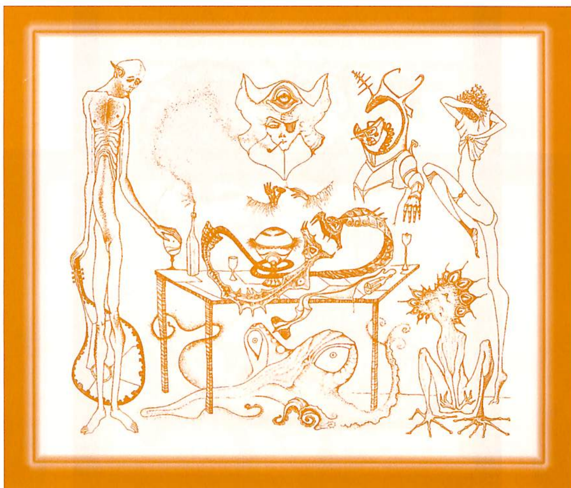
La interrumpida cena del rey Juan Sinojo el 1º (y último) Dibujo, 46 x 35 cm, 1975.