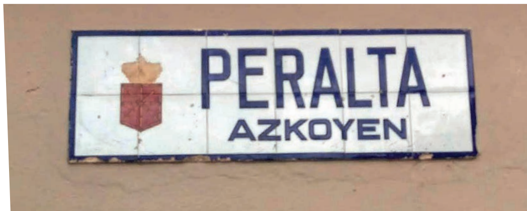
Figura 12. Rótulo bilingüe de Peralta/Azkoyen (c. 1920).