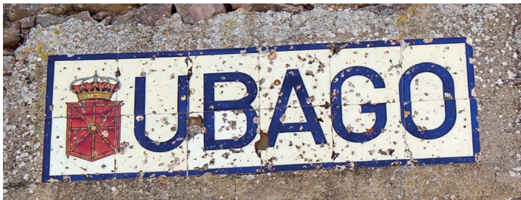
Figura 24. Rótulo de Ubago (c. 1920).