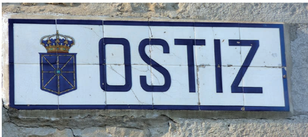
Figura 8. Rótulo de Ostiz (c. 1920).

He podido constatar varios rótulos redactados en bilingüe (figs. 9-12), esto es, con dos denominaciones diferentes, una con el nombre en castellano y otra con su versión euskérica: