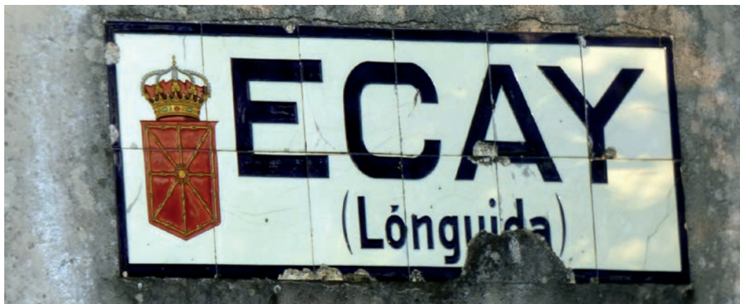
Figura 16. Rótulo de Ekai (c. 1920).