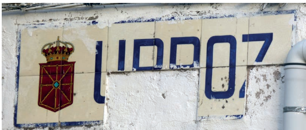
Figura 26. Rótulo de Urroz (c. 1920).