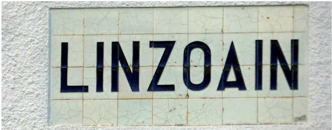
Figura 22. Rótulo de Lintzoain (c. 1950).