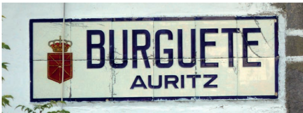
Figura 11. Rótulo bilingüe de Auritz/Burguete (c. 1920).