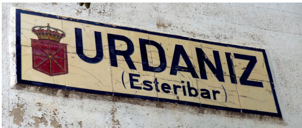
Figura 25. Rótulo de Urdániz (c. 1920).