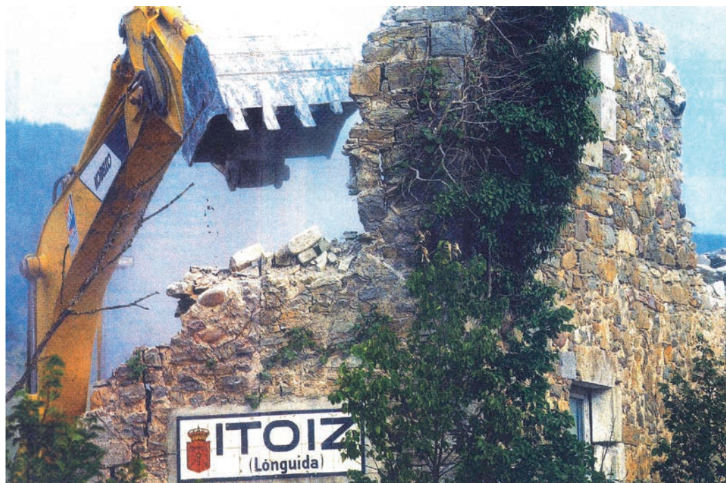
Figura 19. Rótulo de Itoiz (c. 1920).