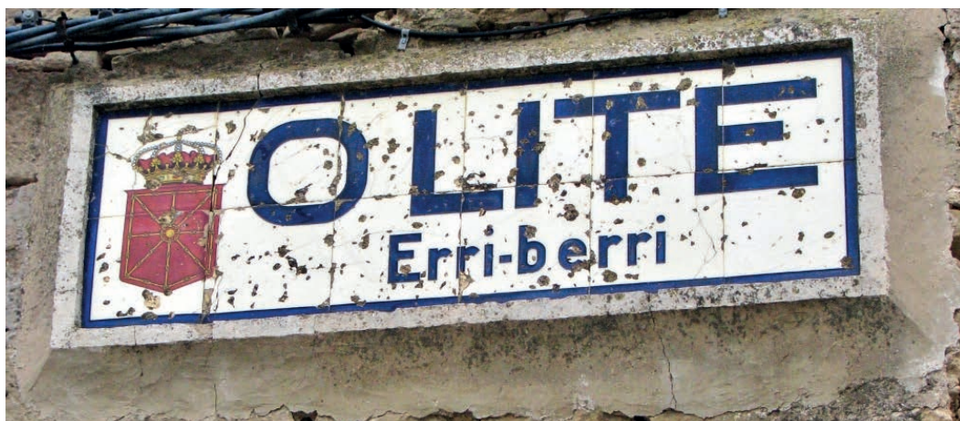
Figura 10. Rótulo bilingüe de Olite/Erri-Berri (c. 1920).