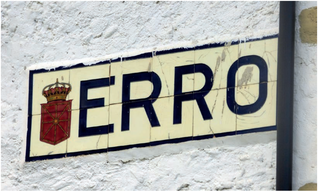
Figura 17. Rótulo de Erro (c. 1920).