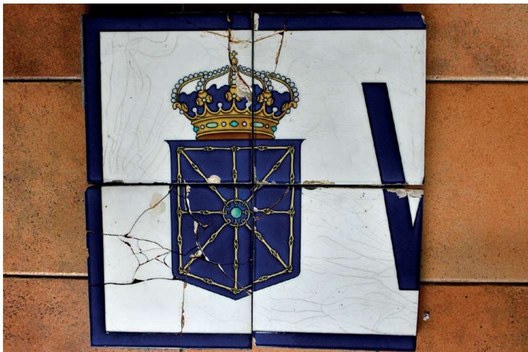
Figura 7. Fragmento del rótulo de Villava/Atarrabia (c. 1920).