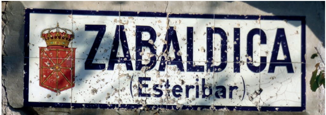
Figura 27. Rótulo de Zabaldika (c. 1920).