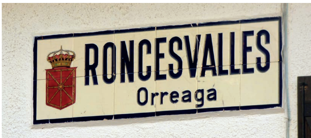
Figura 9. Rótulo bilingüe de Orreaga/Roncesvalles (c. 1920).