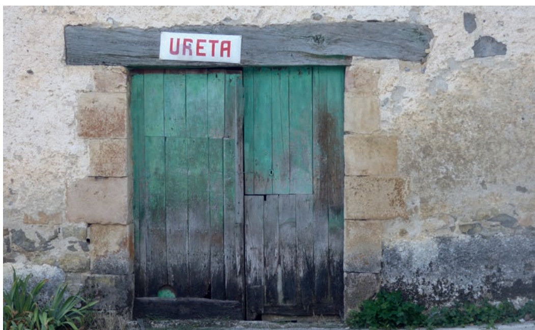
Figura 3. Rótulo de Ureta (c. 1900).

Existen ejemplares en Amaiur, Azpillkueta, Oronoz-Mugairi, Leazkue, Zilbeti, Aurizberri/Espinal, Lusarreta, Aoiz, Iriso, Lizarraga de Izagaondo, Iriso, Pamplona/Iruña, Olite/Erriberri, Mendavia, Salinas de Oro, Azqueta, Agorreta (restos), etc. Sin olvidar, dada su singularidad, uno en mal estado pintado en piedra que se encuentra en Orreaga/Roncesvalles. Otros que no desmerecen son de chapa esmaltada (Aos, Ansoáin, Imízcoz, Lérruz, Muniáin de Arce, Murillo el Cuende, Ureta (fig. 3) o Zilbeti). En cuanto a las placas de numeración de edificios, muchas de ellas todavía las podemos encontrar en numerosas localidades.