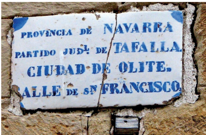
Figura 23. Rótulo de Olite (d. 1860).