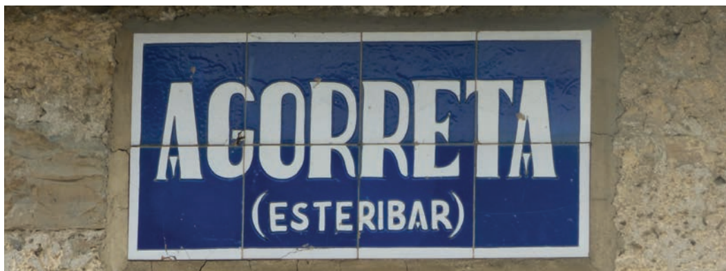
Figura 14. Rótulo de Agorreta (c. 1900).