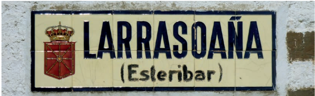
Figura 21. Rótulo de Larrasoña (c. 1920).