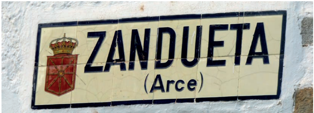
Figura 28. Rótulo de Zandueteta (c. 1920).