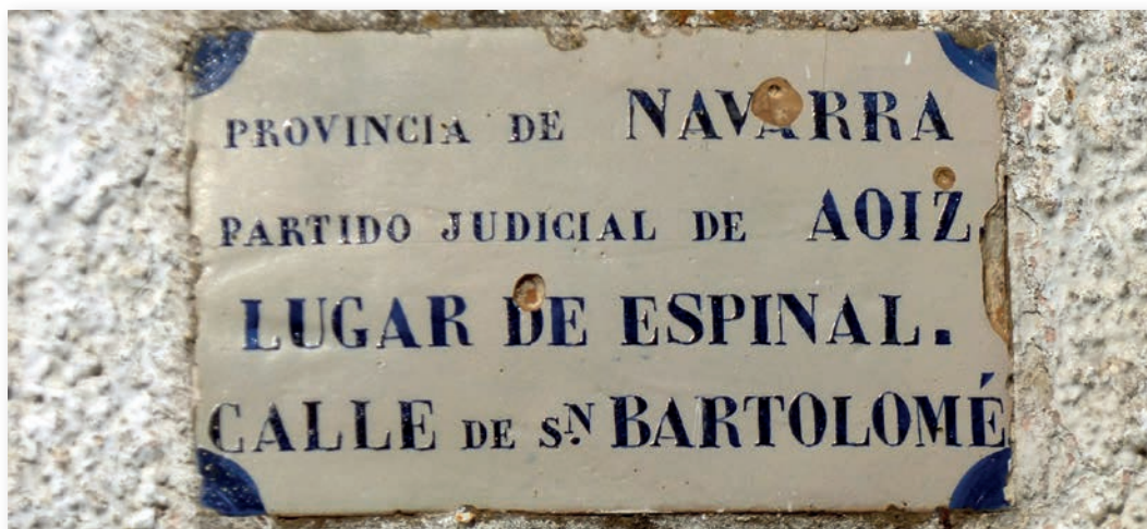
Figura 1. Rótulo de Aurizberri/Espinal (c. 1860).

Los rótulos se debían hacer en azulejo blanco con números y letras en azul y todos uniformes (figs. 1 y 2). Los de las calles tenían que ser costeados por los Ayuntamientos y los de los edificios, tanto los números como otras indicaciones, por los propietarios de los mismos. Se mandaba hacer una revisión cada cinco años a contar desde el 1 de enero de ese año de 1860.