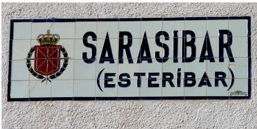
Figura 6. Rótulo de Sarasíbar que muestra la laureada de San Fernando (c. 1950).

Las fábricas de azulejos no debieron de dar abasto, porque meses más tarde se estableció una moratoria que ampliaba el plazo para colocar las placas ( Boletín Oficial del Estado , 2 de junio de 1944). Posteriormente existió una reiteración fechada el 3 de julio de 1949. Fue en esta segunda época cuando se colocó otra partida de rótulos en la que el escudo de Navarra llevaba la Cruz Laureada de San Fernando, vigente en aquel momento (fig. 6).