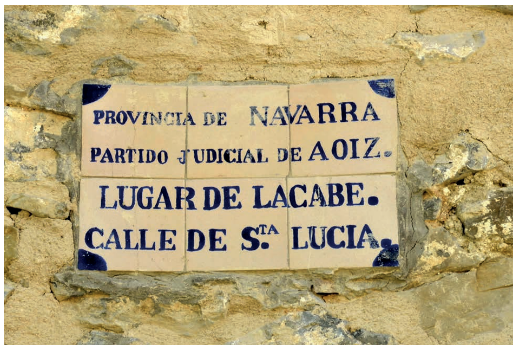
Figura 20. Rótulo de Lacabe (d. 1980).