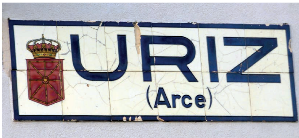
Figura 4. Rótulo de Úriz (c. 1920).

Se colocaron a partir de 1919 y cada población por donde discurría una carretera disponía al menos de uno, aunque generalmente eran dos los conjuntos que anunciaban la localidad, situados en la fachada perpendicular a la carretera del primer edificio de sus entradas principales. En la legislación se detallaba que la colocación de estos rótulos corría a cargo del Ministerio de Obras Públicas, excepto en Bizkaia, Gipuzkoa, Álava y Navarra, al parecer por su particular régimen foral. En Navarra, el trabajo de encargarlos, colocarlos y mantenerlos fue llevado a cabo por la Dirección de Caminos de la Diputación Foral, previo encargo y pago realizado por los Ayuntamientos (figs. 4 y 5).