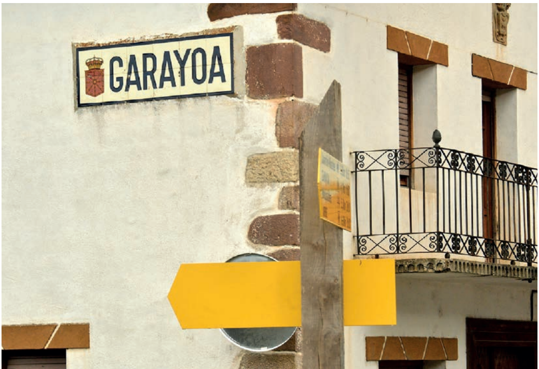
Figura 18. Rótulo de Garaioa (c. 1920).