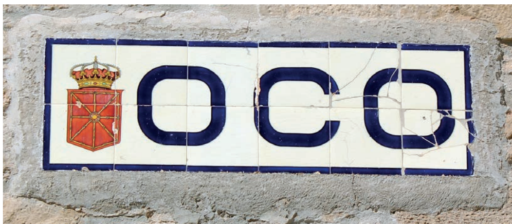
Figura 5. Rótulo de Oco (c. 1920).

Por referencias posteriores sabemos que existió otra instrucción del 11 de agosto de 1939. En 1944 se reiteró esta obligación, en la que se expresó el espíritu de la normativa y algunos detalles sobre los formatos, además de indicar que eran los respectivos Ayuntamientos los responsables de la instalación de los rótulos ( Boletín Oficial del Estado , núm. 54. Orden del 22 de febrero de 1944).