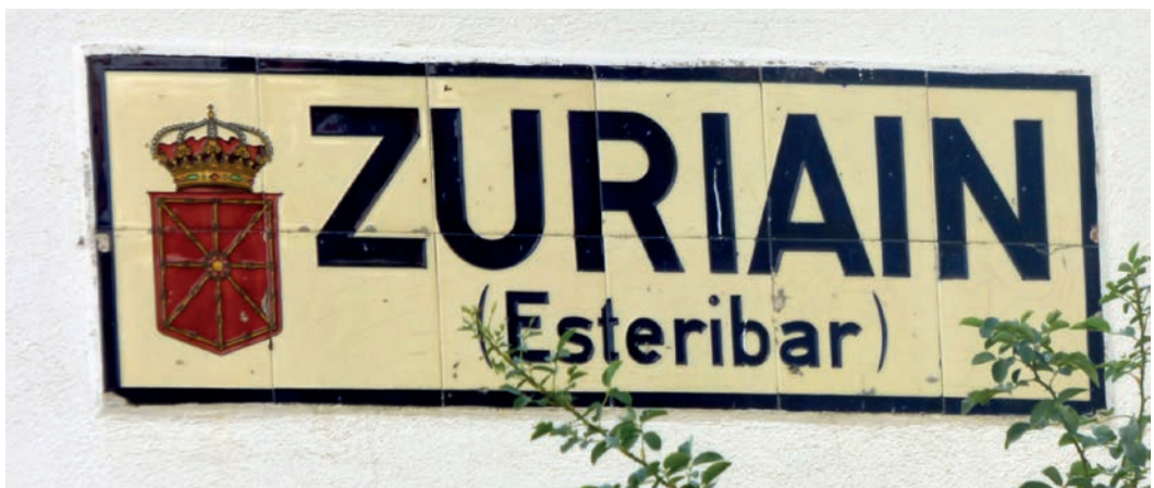
Figura 29. Rótulo de Zuriain (c. 1920).