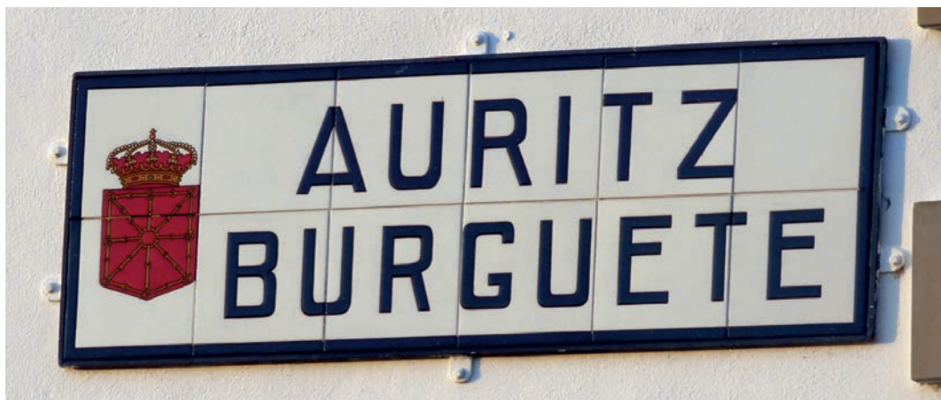
Figura 13. Rótulo de Auritz/Burguete (c. 2010).

de Navarra hacia 1920. Que en éste aparece el nombre actual de la villa, pero con el diseño de aquella época y que se ha colocado en la pared lateral de casa Otermin. El Ayuntamiento se da por enterado (fig. 13).