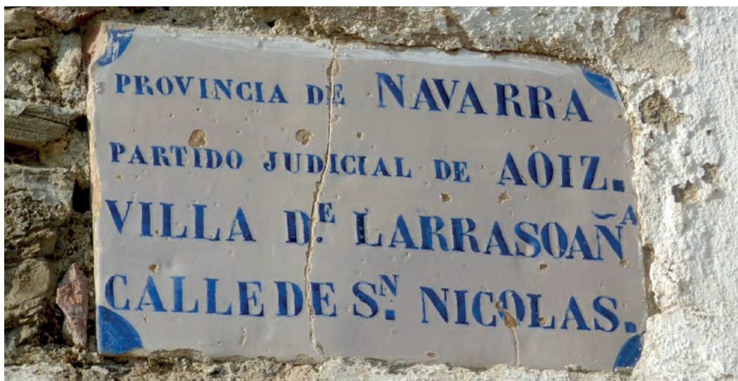
Figura 2. Rótulo de Larrasoña (c. 1860).

Existen ejemplares en Amaiur, Azpillkueta, Oronoz-Mugairi, Leazkue, Zilbeti, Aurizberri/Espinal, Lusarreta, Aoiz, Iriso, Lizarraga de Izagaondo, Iriso, Pamplona/Iruña, Olite/Erriberri, Mendavia, Salinas de Oro, Azqueta, Agorreta (restos), etc. Sin olvidar, dada su singularidad, uno en mal estado pintado en piedra que se encuentra en Orreaga/Roncesvalles. Otros que no desmerecen son de chapa esmaltada (Aos, Ansoáin, Imízcoz, Lérruz, Muniáin de Arce, Murillo el Cuende, Ureta (fig. 3) o Zilbeti). En cuanto a las placas de numeración de edificios, muchas de ellas todavía las podemos encontrar en numerosas localidades.