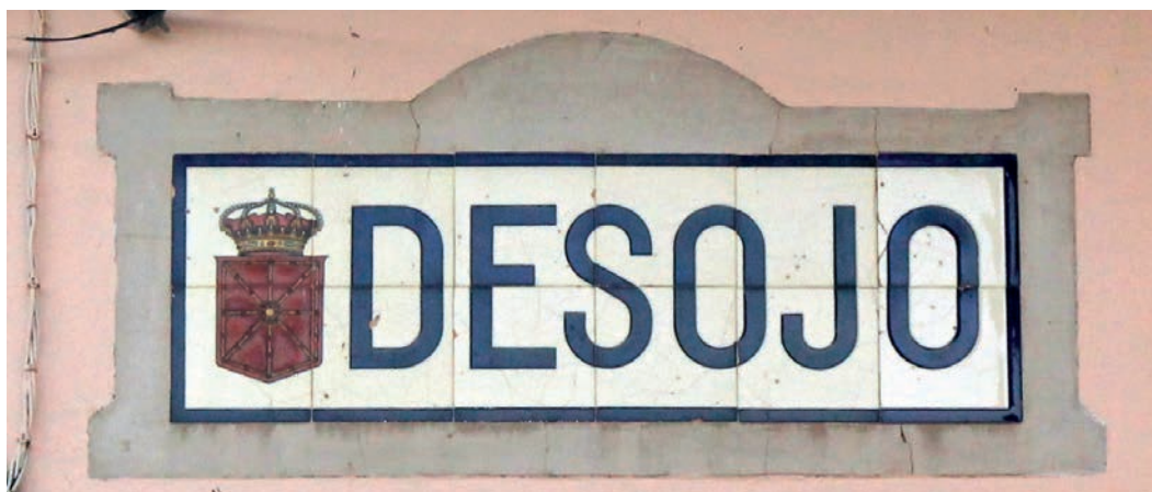
Figura 15. Rótulo de Desojo (c. 1920).