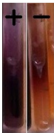
Figura 3. Interpretación en medio LIA.

fragmentos con tamaños de 100 a 1500 pb, de los cuales la banda de 500 pb contiene el triple de concentración molar que el resto y sirve como un visible indicador de referencia.