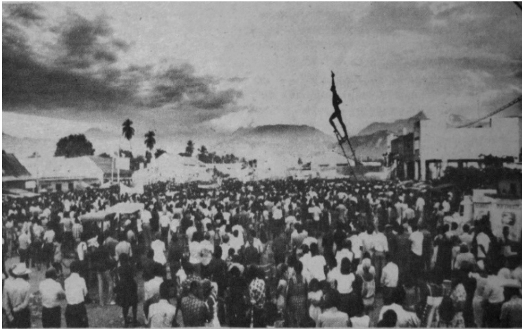
Figura 2. Actos en Ciénaga. Al fondo, el monumento Prometeo de la Libertad