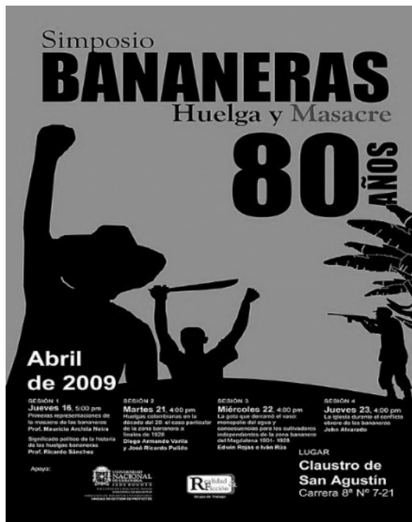
Figura 5. Afiche del simposio “Bananeras. Huelga y masacre. 80 años”