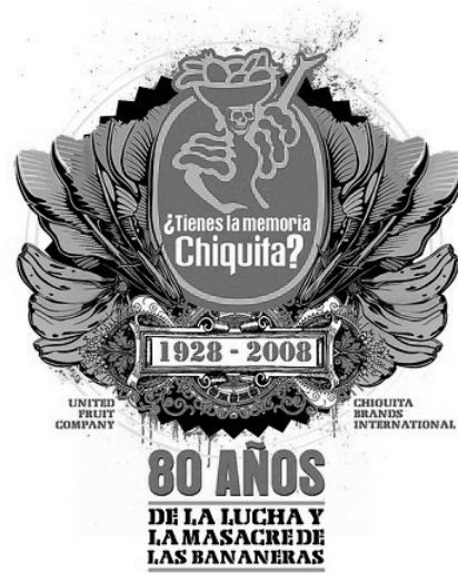
Figura 4. Calcomanía conmemorativa [2008]