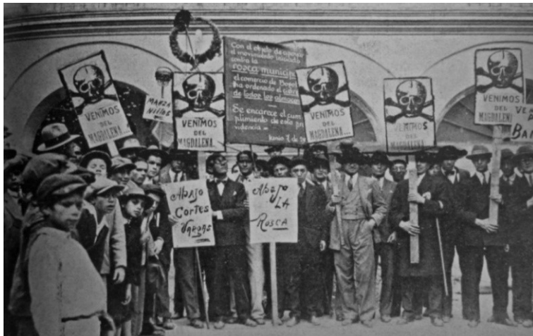
Figura 1. Manifestantes en Bogotá en junio de 1929 portando carteles que aluden a la masacre de las bananeras

Fuente: Renán Vega, Gente muy rebelde , t. 3 (Bogotá: Pensamiento Crítico, 2002) 189.