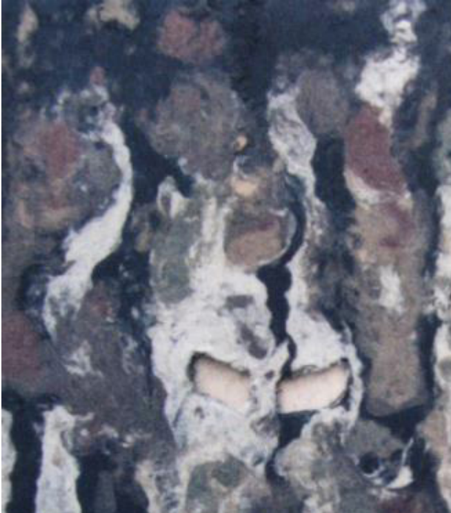
1 máscarAs (rev) Fibras de cartón de caña reciclado teñidas y de algodón

Mi acercamiento al washi zokei data de 1991, año en que el Maestro Teiji Ono, impartió como parte del Seminario de Setagaya para Artes Plásticas en papel japonés, el “Curso de Washi Zokei. Papel japonés hecho a mano” en la Escuela Nacional de Artes Plásticas (ENAP), hoy Facultad de Artes y Diseño (FAD), (Ciudad de México). El objetivo de este curso fue conocer el material y su manera de aplicación.