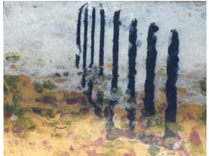
4 Inundación 2 Fibras de papel de algodón y de caña reciclados y teñidas

Para hacer la hoja de papel se requiere un bastidor de madera con una malla metálica o plástica tensada, en éste se distribuye, de manera uniforme, la mezcla; en la tela se mantendrá la fibra, mientras que el excedente de agua drenará a través de los orificios de la malla. El secado se realiza de diversas maneras, dejar la hoja en el bastidor al sol o en el interior, o retirarla del bastidor, ubicándola en una superficie de madera y proceder al exprimido por medio de una prensa.