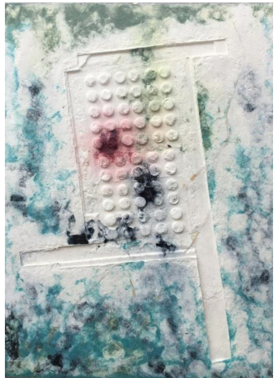
18 Panacea Fibras de algodón teñidas