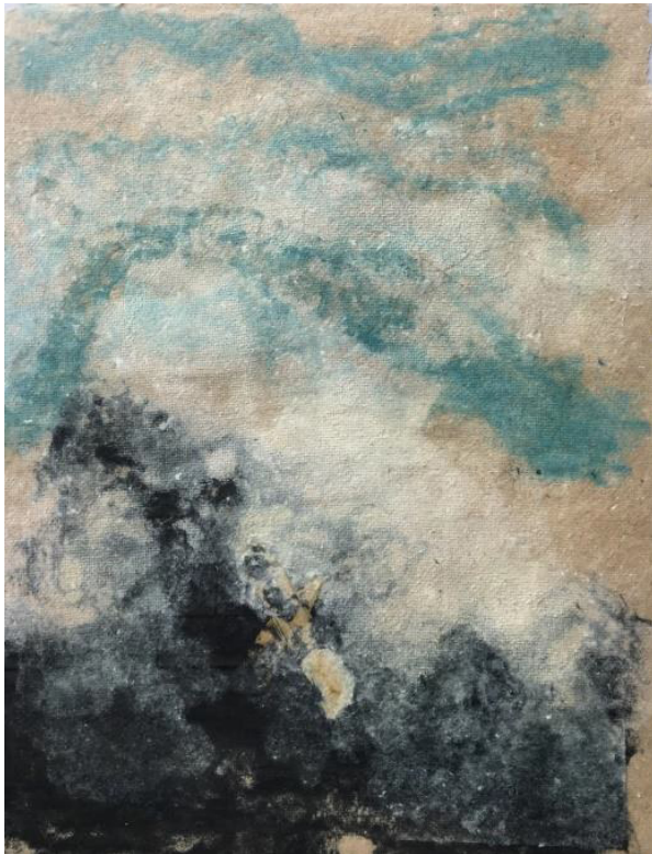
17 Signo oculto Fibras de algodón teñidas con elementos orgánicos