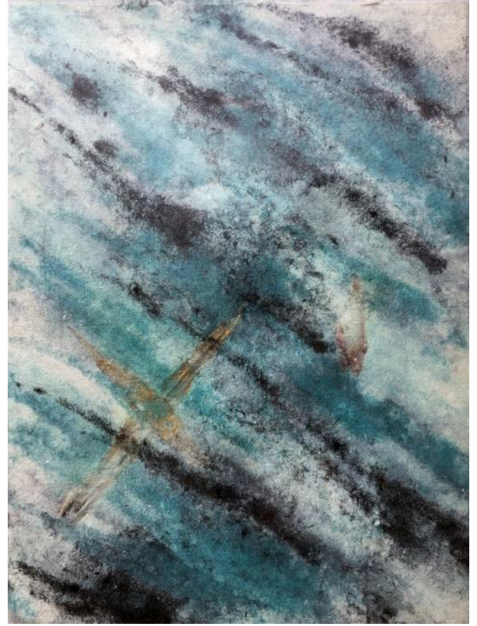
14 Lluvia ácida Fibras de algodón teñidas y hojas de penacho de piña