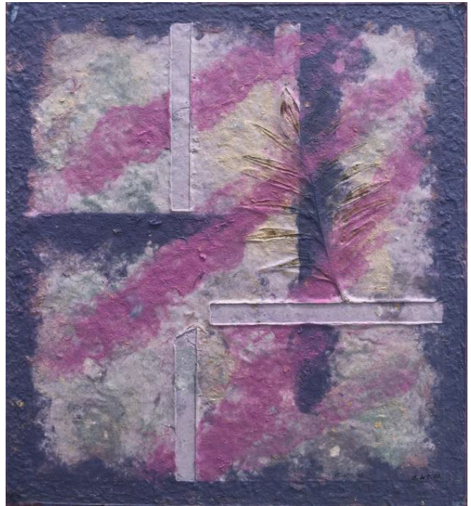
6 Adiós Fibras de papel de algodón reciclado teñidas y hojas

Aproximación a las cualidades estéticas del Washi Zokei