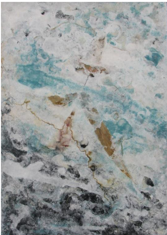
15 Emergiendo, Fibras de algodón teñidas, hojas y elementos orgánicos