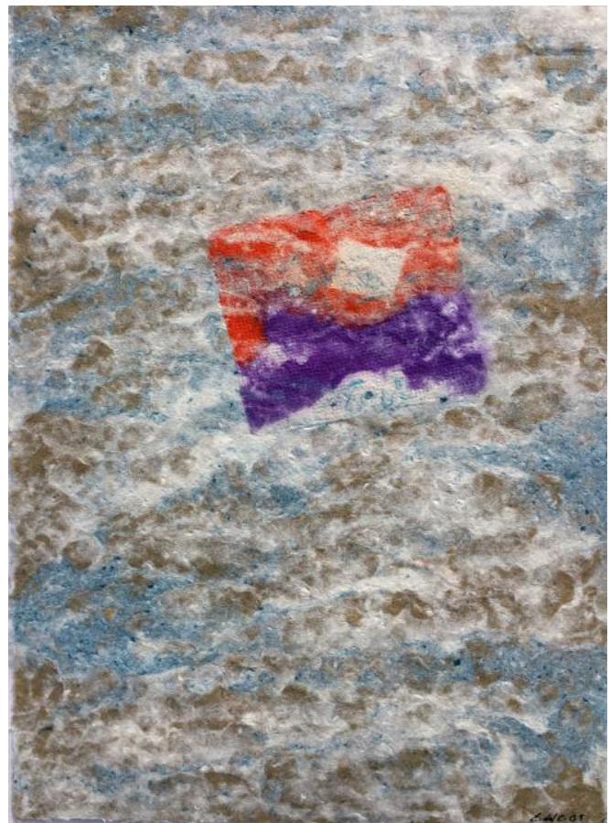
12 Marea Fibras de algodón teñidas e hilos