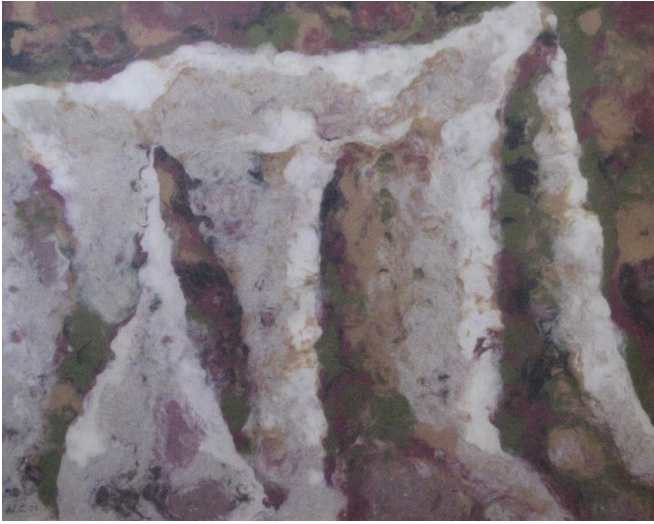
5 El paso del tiempo Fibras de papel de algodón teñidas y de cartón reciclado de caña

del artista. Así, en el arte contemporáneo la materia, no es sólo soporte o parte física que sostiene la obra, sino que en innumerables ocasiones es su fin mismo, el propio discurso del objeto estético. (Puerta, 2001. p. 224).