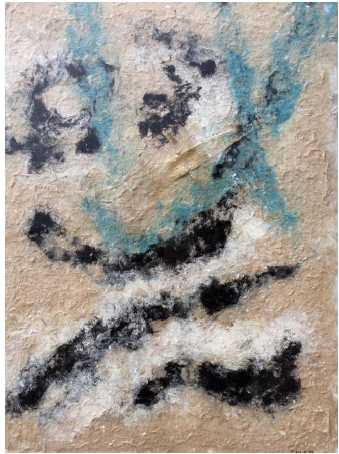
16 Signos Fibras de algodón teñidas, elementos orgánicos y hojas de pino