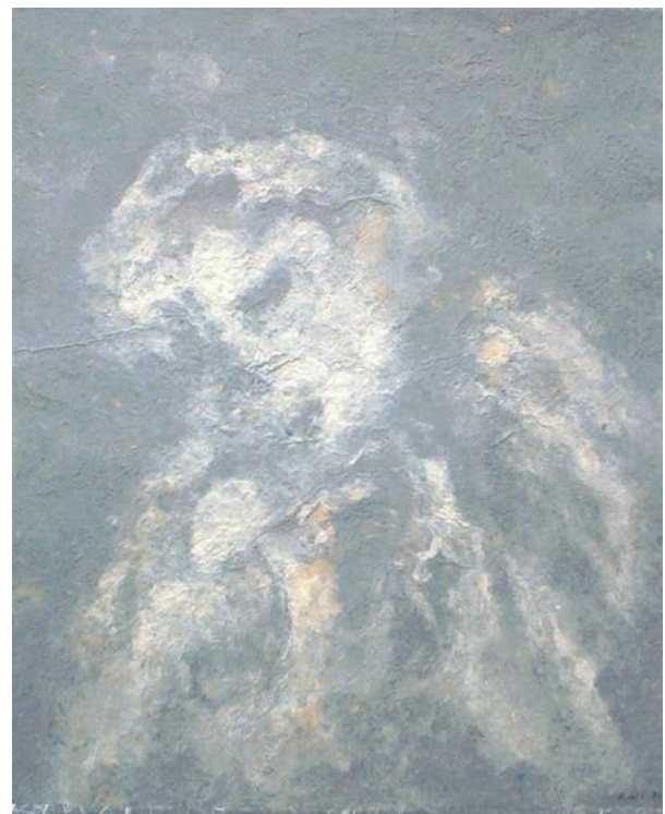
7 Olvidos Fibras de papel de algodón teñidas