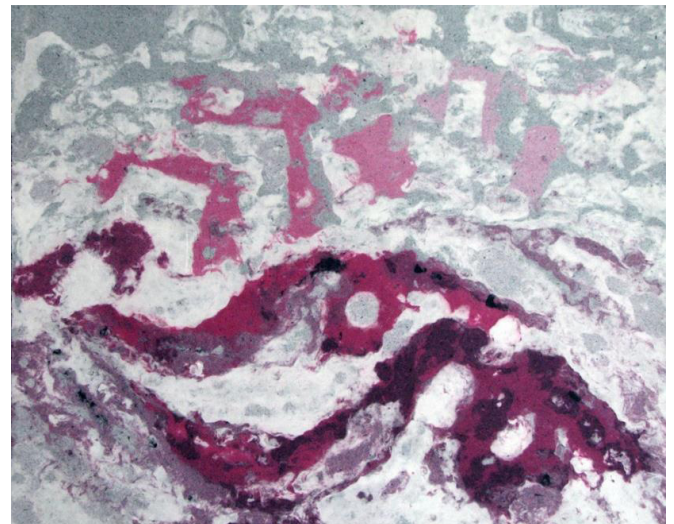
20 Memorias Fibras de algodón teñidas

Es así como las cualidades del washizokei aluden a un proceso sensorial y, de acuerdo a Juan Acha, operaciones sensoriales ejercidas por el perceptor que se dirigen hacia las propiedades sensibles –materiales y formales– del objeto con la intención de tomar conciencia de ellas, valorarlos y/o disfrutarlos, de acuerdo a sus intereses.