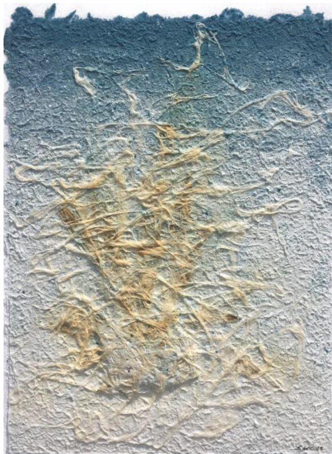
11 Museo Fibras de algodón teñidas y fibras de penacho de piña