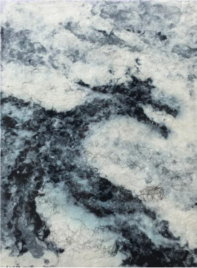
13 La virtud de la adversidad Fibras de algodón teñidas, y cabellos