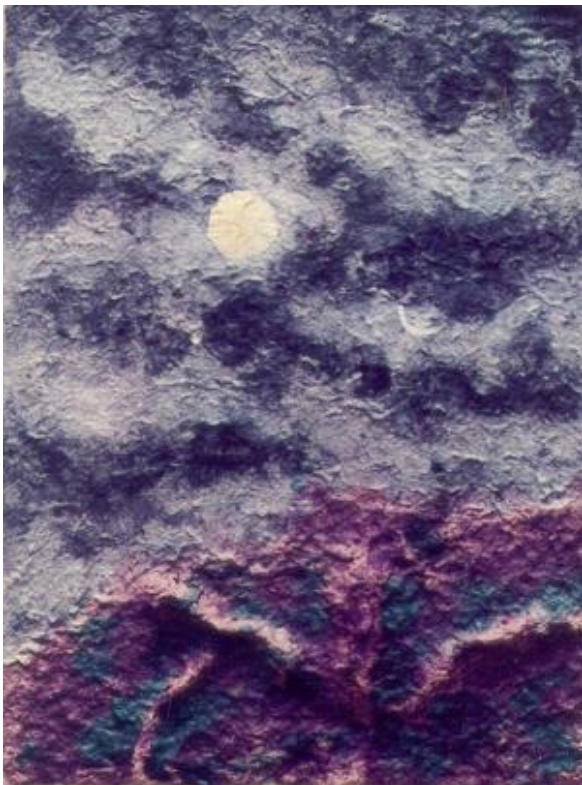
3 Paisaje nocturno Fibras de algodón teñidas y papel metálico.