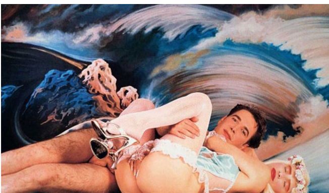
[Fotografía de Jeff Koons] (1989). Made in Heaven Series .

Conceptualmente, esta instalación se articula como la aleación entre el placer masoquista y la muerte. La autoprocurementación del dolor como un éxtasis carnal que te aproxima a una especie de trance mortuorio.