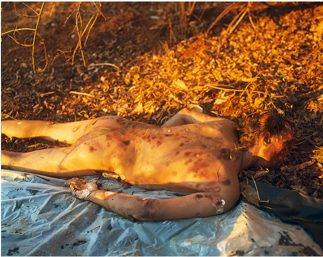
[Fotografía de Sally Mann]. (2000-2001). Body Farm Series.

padecimiento. Simplemente se muestra abierta a la mirada del otro, sin reparos y con total desenvoltura. En algunas imágenes se le aprecia firme, en otras jocosa y en otras el posado se acerca a un misticismo de aire clásico. En ningún momento se observa padecimiento; si acaso una dulce languidez, que nos hace entrever una sosegada aceptación hacia el irremediable final.