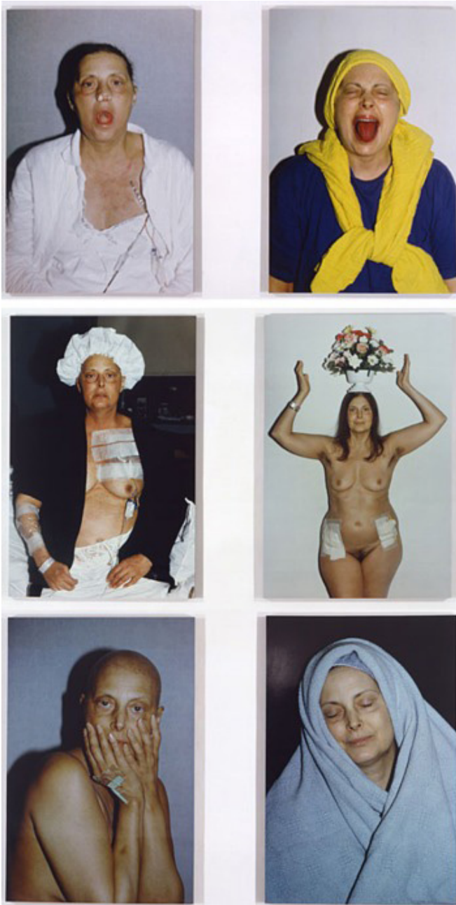
[Fotografías de Hannah Wilke]. (1992-1993). Intra Venus Series.

minan justificando y perpetuando la existencia de ciertas acciones violentas. Por otro lado, analiza por qué los medios de masas se afanan en mostrar la violencia en sus soportes. Es obvio cómo la violencia queda representada en cualquier ámbito de los media; telediaros, series, cine, dibujos animados, videojuegos, etc. en donde se reproducen actos iracundos como mera distensión. A su vez el arte hará lo propio, partiendo de muchos de los contenidos y lenguajes de dichos soportes. Sin embargo, la ejerción de la violencia sobre otro sigue siendo vilipendiada bajo prámetros morales que la catalogan como acto incívico o primario.