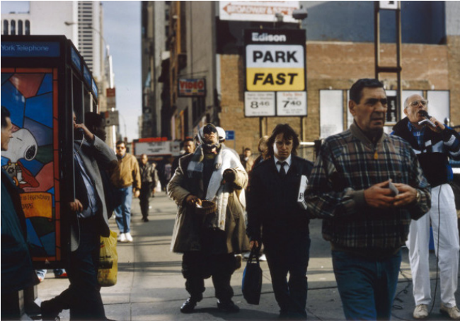
[Fotografía de Philip-Lorca diCorcia]. (New York.1993). Reflections on Streetwork Series.

La categorización de paria de la que partimos, proviene de los condicionantes prefijados en el mundo occidental. Por lo que situándonos desde esta perspectiva, éste se perfilará en aquellos grupos de ciudadanos que dado su condición social, económica, ideológica, física o cultural, se encuentran alejados de los estándares de la normalidad. Por paria social se entiende todo aquel cuya conducta no se adscribe a la normativa imperante, por lo que recibe un trato discriminatorio por el conjunto de la sociedad. Tras un análisis sobre los perfiles que más se tipifican en el ámbito de las industrias culturales y que se involucran con el término paria, se ha llegado a la conclusión de que podrían ser desglosados en tres tipos que se ha decidido nominar: el subversivo, el desviado y el humilde.