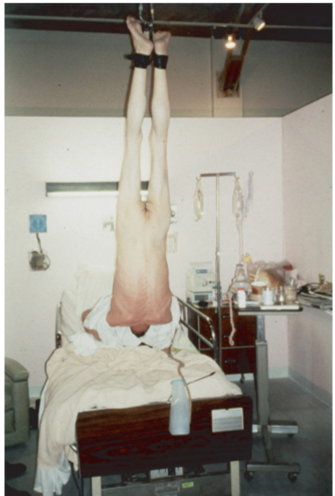
Vista del performace de Bob Flanagan. Visiting Hours , Santa Mónica Museum of Art, Santa Mónica, California, USA, 1994.

El cadáver, dejado en medio del olvido de una naturaleza que se presenta agreste, por un lado reafirma la propia idea de violentar la noción de respeto sobre los difuntos que se tiene culturalmente; por otro, enlaza con la idea más estricta de una naturaleza salvaje e indómita, en la que la violencia y la muerte no son más que un hecho natural. Las fotografías de Body Farm desvinculan al cuerpo retratado de cualquier referencia a una vida pasada, a una identidad o a una condición social. El cadáver se expone como desecho, como objeto abandonado a su suerte en