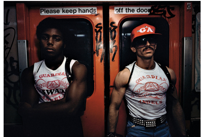
[Fotografía de Bruce Davidson]. (New York.1980). Subway Series.

Wacquant (2001) describe “la nueva marginalidad”, como aquellas convenciones que se encontrarían ligadas al perfil del humilde. Hombres y familias sin hogar que bregan vanamente en busca de refugio; mendigos en los transportes públicos que narran extensos y desconsoladores relatos de desgracias y desamparo personales; comedores de beneficencia rebosantes no sólo de vagabundos sino de desocupados y subocupados; la oleada de delitos y rapiñas, y el auge de las economías callejeras informales (y las más de las veces ilegales), cuya punta de lanza es el comercio de la droga; el abatimiento y la furia de los jóvenes impedidos de obtener empleos rentables y la amargura de los antiguos trabajadores a los que la desindustrialización y el avance tecnológico condenan a la obsolescencia. (Wacquant, 2001, p.170) Philip-Lorca diCorcia hará un apunte sobre las especificaciones de Loïc Wacquant en la serie fotográfica Reflections on Streetwork (1993-1997).