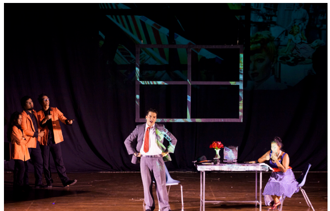
Imagen 3 y 4. Puesta en escena de Historia de la ópera en seis cuadros de Monteverdi, Mozart, Puccini, Ravel, Britten y Bernstein, presentada en la Sala Beethoven del Instituto Departamental de Bellas artes en el primer semestre de 2014.