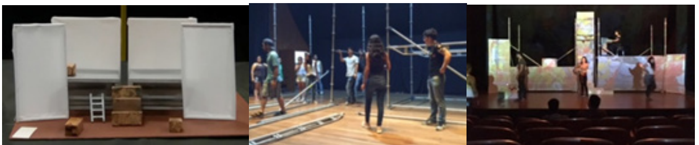
Imagen 3. Trabajo de producción escenográfica y ensayos de I Due Timidi de Nino Rota presentado en la Sala Beethoven del Instituto Departamental de Bellas Artes en Cali-Colombia en 2017

Por su parte, el artículo de Trecca (2010) presenta un panorama sobre la evolución de los estudios que atañen las relaciones entre el teatro y los medios audiovisuales en España, atendiendo la variedad de visiones sobre el tema desde sus rasgos pragmáticos hasta sus rasgos expresivos y comunicativos; es así como este trabajo se convierte en un importante punto de partida para acceder a un estado del arte sobre las relaciones entre escena, nuevas tecnologías, comunicación de masas y evoluciones performativas. Este autor presenta de forma clara y precisa el panorama crítico español desde distintas perspectivas y los enfoques de diferentes autores, que permiten a esta investigación, develar algunos aspectos de la puesta en escena teatral contemporánea que hace uso de nuevas tecnologías audiovisuales a través de los autores vigentes más influyentes. Por su parte, el artículo de Cornago Bernal (2004) hace alusión a la construcción de una nueva realidad mediática, debido a las implicaciones que tienen los grandes medios de comunicación como agentes de transformación de las distintas formas