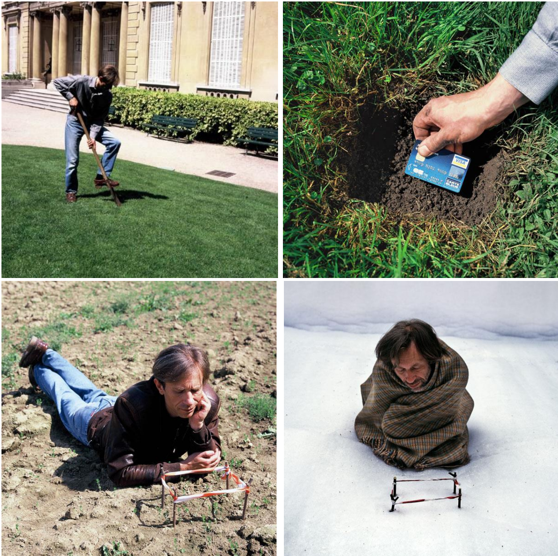
Imagen 5. D. Tsykalov: Plantation à la carte

las familias se parchean con endeudamiento de forma algo arriesgada. También el afán consumista explica parte de la dependencia del uso de la tarjeta de crédito. La política económica podría reducir esta dependencia impulsando mejoras salariales para los trabajadores y/o mejores transferencias sociales para los necesitados.