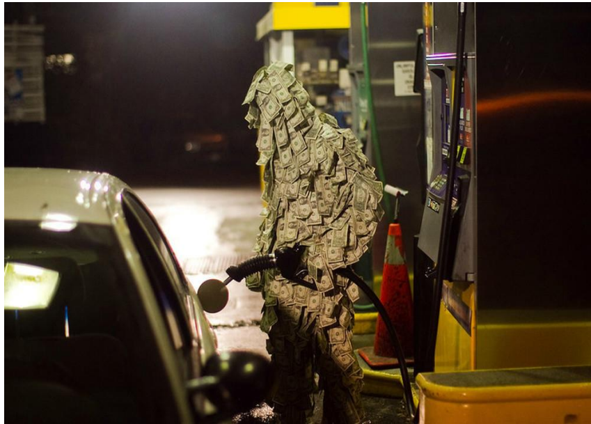
Imagen 4. J. Hickey: Money Man

La imagen transmite la idea de que alguien se está aprovechando y enriqueciendo gracias a nuestra dependencia del petróleo, un producto muy contaminante que está dañando seriamente al planeta. Esta imagen evoca muchas posibles actuaciones político-económicas: el desarrollo de energías alternativas, la lucha contra el cambio climático, políticas de transporte público y reducción del uso del coche privado, aumento de la competencia en el sector energético, etc.