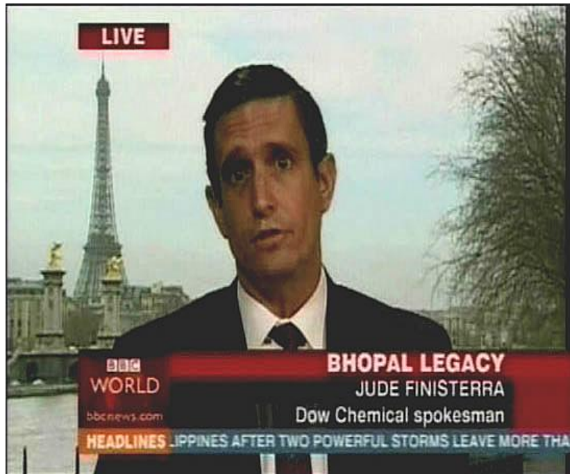
Imagen 7. The Yes Men: The Yes Men Fix the World

La imagen 7 es un fotograma del documental The Yes Men Fix the World en el que aparece uno de los miembros del grupo haciéndose pasar por el portavoz de la empresa química Dow Chemical en una entrevista en el noticiario de la BBC. En ella admitía la culpa de la empresa por el envenenamiento masivo causado por una fuga de gas tóxico en Bhopal (India) en los años 80 y anunciando indemnizaciones. Lamentablemente eso era una broma, lo deseable es que la política se hiciera valer de mecanismos para establecer condiciones de producción y laborales seguras y respetuosas con el medioambiente y, en caso necesario, poder obligar a las empresas causantes de desastres medioambientales a asumir sus responsabilidades.