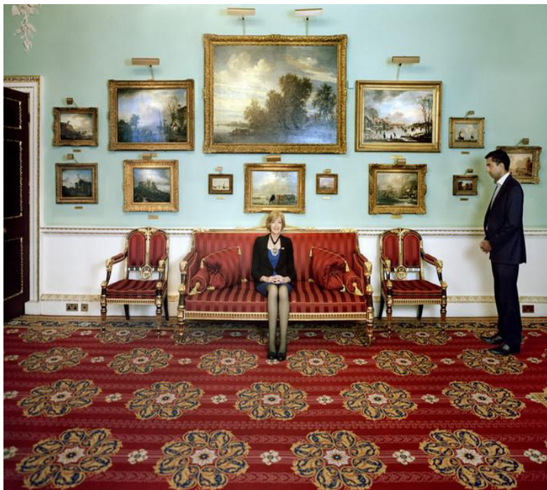
Imagen 2. G. Galimberti y P. Woods: The Heavens

La imagen 2 refleja la riqueza, la exclusividad y la ostentación que rodean los lugares y las personas que frecuentan los paraísos fiscales. Ofrece una idea de la cantidad de riqueza acumulada en esos lugares exóticos, muy distintos a los lugares donde esa riqueza se creó y donde se le exige que contribuya a mantener los gastos derivados de los servicios públicos. Las implicaciones político-económicas que evocan estas imágenes remiten a preguntarse cómo se puede evitar la fuga de capitales, la evasión y elusión fiscal, y hacer que sus dueños paguen lo que deben, al igual que hacen los demás.