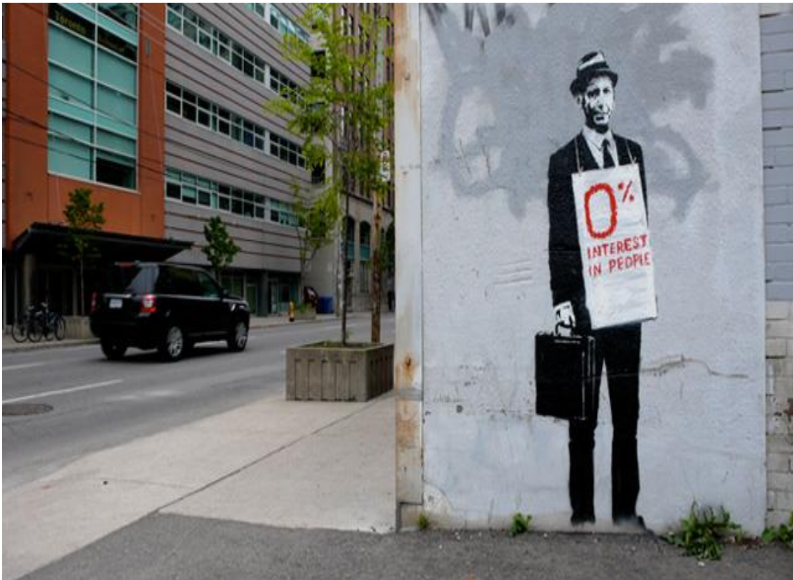
Imagen 1. Banksy: sin título

En la imagen 1, Banksy transmite la idea de que el sistema financiero no atiende las necesidades de las personas, que su funcionamiento está al margen de los objetivos de la sociedad, como si la lógica de la maquinaria financiera del sistema económico estuviera desconectada de aquella. Esta imagen recuerda un sistema financiero que crea burbujas y crisis a través de la especulación con activos que tienen poca conexión con el mundo real. La última crisis financiera mundial de 2008 es un ejemplo cercano de esto. Las implicaciones de política económica que evoca esta obra son evidentes: hay que modificar el sistema financiero, hay que regularlo más eficazmente para evitar comportamientos socialmente irresponsables que acaban generando costes a la sociedad.