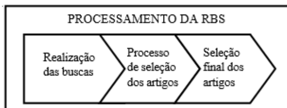
Figura 1. Esquema da sequência das etapas percorridas pela RBS

Na sequência, com todos os critérios da primeira fase (entrada) definidos, é realizada a busca. Primeiro optando por uma busca geral para conhecer quantitativamente o cenário das publicações na área e em seguida aplicando critérios de exclusão para que o material coletado apresente a qualidade pretendida. A Figura 1 apresenta um esquema da sequência das etapas percorridas pela RBS.