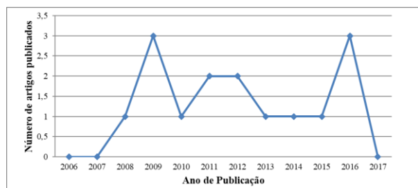
Figura 2. Quantidade de publicações em referência a IC no âmbito da gestão organizacional, 2006 a 2017

A Figura 2 apresenta a quantidade de artigos referente à IC na gestão organizacional publicados anualmente no período. Nos anos de 2009 e 2016, verificou-se um maior número de publicações sobre IC no âmbito da gestão organizacional, com três publicações cada. Nos anos de 2006, 2007 e 2017 não foi localizada qualquer publicação acerca do tema e, em 2011 e 2012, foram encontradas duas publicações em cada ano. Nos demais anos, foram publicados apenas um artigo por ano com esta temática, o que sugere se tratar de um tema que tem sido explorado, mas que não apresenta um grande número de publicações.