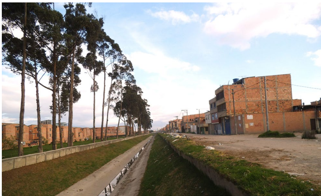
Figura 2: Patio Bonito y Calandaima. Canal que divide los barrios de la UPZ Patio Bonito y las nuevas dinámicas de urbanización de la UPZ Calandaima a la izquierda

A pesar de los desarrollos urbanos acelerados, luego de que el occidente de Bogotá se convirtiera en un escenario prometedor para el sector inmobiliario y