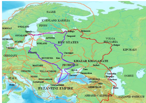
Figura 2. Mapa en el que se observan las principales rutas comerciales varegas. En rojo, la Ruta del Volga; en púrpura, la Ruta del Dniéper (de los varegos a los griegos); en naranja, otras rutas comerciales 9 .

Dniéper 8 (fig. 2). Ambas tenían su punto de partida en el lago Ladoga, debiendo remontar previamente el río Nieva. En el Ladoga tenían la posibilidad de tomar distintas vías, llegando algunas a ciudades importantes, y siendo otras grandes rutas comerciales. Parece ser que la ruta del Volga era algo más segura que la del Dniéper, aunque, debido a las condiciones geográficas, ambas rutas obligaban a los varegos a tener que abandonar el cauce fluvial, teniendo que llevar los barcos consigo por tierra.