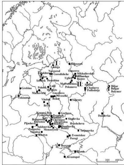
Figura 4. En el mapa se muestra la dispersión de objetos de origen escandinavo por diferentes lugares del este europeo 72 .

Gracias a este enfoque, se observa que, para el siglo X, los objetos de procedencia escandinava han descendido a niveles ínfimos o nulos, lo cual indica que, para este siglo, la población vikinga había ya sufrido un proceso de eslavización muy profundo 71 . Más allá de ello, gracias a la gran cantidad de objetos encontrados en diversas campañas arqueológicas, se conocen con bastante precisión las diferentes rutas comerciales que los Rus realizaban, pudiendo asociarse los diferentes objetos a diferentes rutas comerciales y a contactos con diversos lugares del mundo.