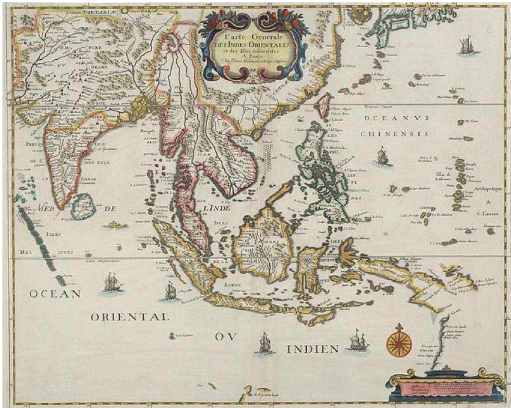
Figura 2. Mapa de las Indias Orientales hecho en Paris en 1650. Institute for Maritime and Ocean Affairs, Filipinas.

El Galeón de Manila era el puntal esencial de la presencia española en el Sudeste asiático, dado que del mismo dependían tanto el comercio de los productos chinos que eran embarcados hacia Acapulco como las remesas de plata del tornaviaje que servían para el comercio con todas las grandes islas de Indonesia, la India, Japón y, muy especialmente, con China 13 .