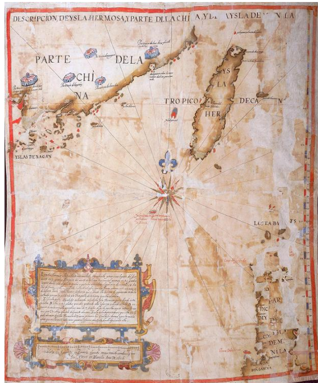
Figura 1. Mapa de la isla Hermosa, región septentrional de la de Luzón y costa de la China cercana en 1626. AGI, MP-FILIPINAS,141 - 1

Formosa, lo que forzó la ocupación de la parte norte de esta isla por los españoles en 1626 10 .