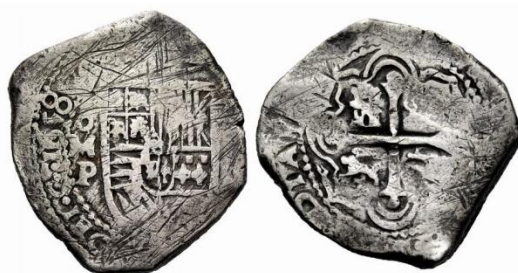
Figura 3. Ocho reales, México, 1658, P. Cayón Subastas, Subasta 9 de mayo de 2013, lote 332,