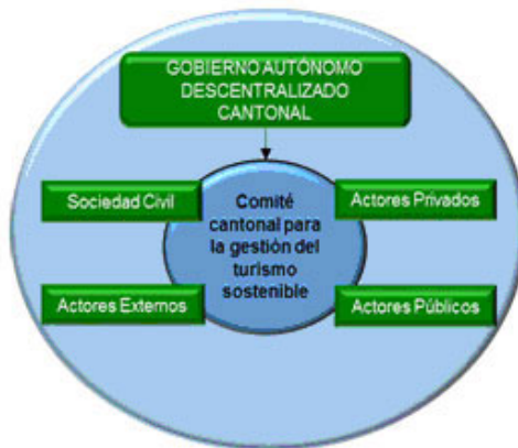
Figura 2 . Comité cantonal para la gestión del turismo sostenible