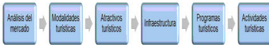
Figura 3 . Pasos para la elaboración de programas turísticos

agregados que aporten identidad y ventajas competitiva, figura 3 .