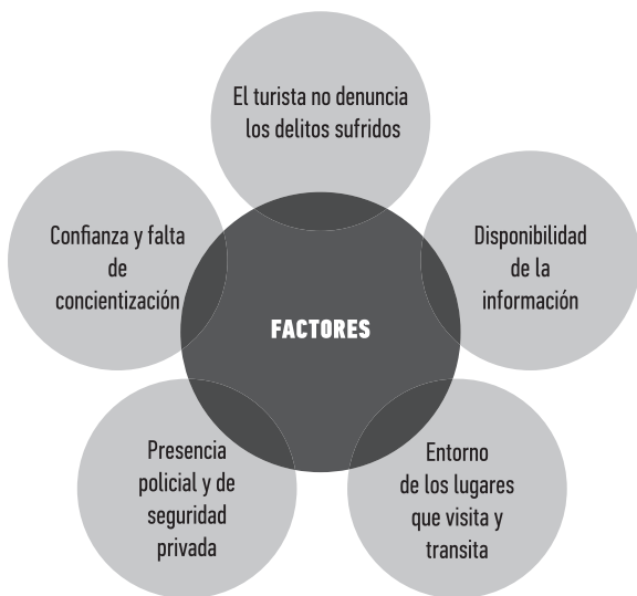
Figura 2. Factores que condicionan la seguridad del turista Nota: Elaboración propia a partir de López (2017).

Considerando que la seguridad es una condición fundamental para el fortalecimiento de la competitividad turística, es necesario que la prioridad del estado mexicano sea la de buscar los mecanismos de coordinación y de gestión que permitan articular medidas prácticas para que la actividad turística se consolide. La Figura 2 muestra los elementos o factores que inciden en la seguridad de los turistas.