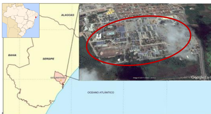
Figura 1. Mapa de localização geográfica do campus Universitário “Prof. José Aloísio de Campos”, São Cristóvão-Sergipe.

O presente trabalho foi desenvolvido no campus Universitário “Prof. José Aloísio de Campos”, localizado no município de São Cristóvão, Sergipe (Figura 1). O campus de São Cristóvão possui, aproximadamente, 154,17 ha, onde estão distribuídas áreas construídas e áreas verdes. As primeiras representam as salas de aula, centros de estudos, reitoria, biblioteca, prefeitura, restaurantes, lanchonetes, banco, escola, setor esportivo, fórum, almoxarifado, estacionamento, etc. As segundas representam a vegetação formada, principalmente, por exemplares da Mata Atlântica, uma vez que a universidade foi construída em um local onde havia predominância deste bioma.